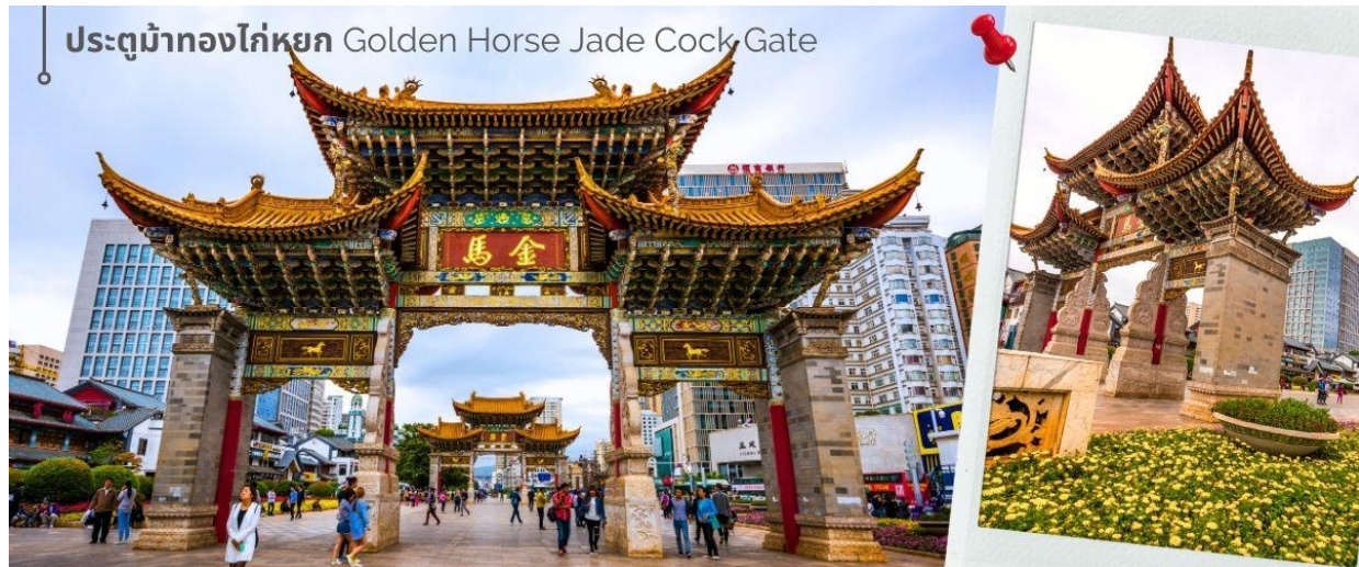
ประตูม้าทองไก่อหยก Golden Horse Jade Cock Gate

ชม ซุ้มประตูม้าทอง และ ซุ้มประตูไก่อหยก ซึ่งภาษาจีนเรียกว่าจินหม่า และปี้จี จึงเอาคำย่อ จินปี้ มาชานานนามถนนแห่งนี้ ซุ้มม้าทองและไก่อหยก มีอายุร่วม 400 ปี สร้างขึ้นในสมัยราชวงศ์หมิง ในถนนย่านการค้าแห่งนี้ เป็นแหล่งเสื้อผ้าแบรนด์เนมทั้งของจีนและต่างประเทศ รวมทั้งเครื่องประดับ อัญมณี ร้านเครื่องดื่ม และร้านขายของที่ระลึกมากมาย