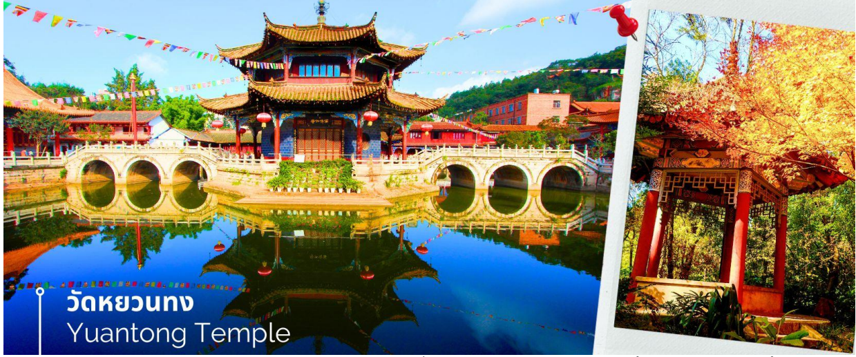
วัดหยวนทอง Yuantong Temple

นำท่านชม วัดหยวนทอง (Yuantong Temple) วัดแห่งนี้เป็นวัดที่ใหญ่และเก่าแก่ที่สุดในเมืองคุนหมิง สร้างมาตั้งแต่สมัยราชวงศ์ถัง มีอายุยาวนานประมาณ 1,200 กว่าปี การสร้างวัดแห่งนี้จะแปลกตากว่าวัดอื่นในจีน เพราะปกติแล้วการสร้างวัดของจีนส่วนมากจะต้องสร้างอยู่บนภูเขา แต่วัดหยวนทองสร้างวัดต่ำกว่าภูเขา โดยวิหารจะอยู่ต่ำที่สุด เนื่องจากวัดแห่งนี้ไม่ได้สร้างขึ้นเพื่อเป็นวัดโดยตรง แต่เคยเป็นศาลเจ้าแม่กวนอิมมาก่อน