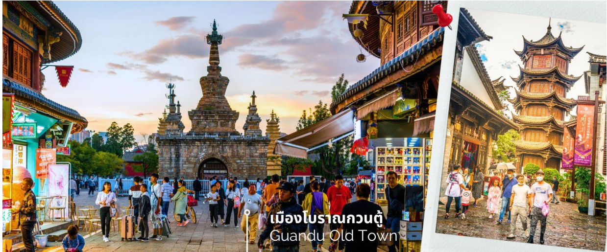
เมืองโบราณกวนตุ๋ Guandu Old Town

นำท่านชมบรรยากาศ เมืองโบราณกวนตุ๋ (Guandu Old Town) เป็นหนึ่งในต้นกำเนิดของวัฒนธรรมยูนนาน และยังถือเป็นหนึ่งในภูมิทัศน์ทางประวัติศาสตร์และวัฒนธรรม ที่สำคัญของเมืองคุนหมิง เมืองโบราณแห่งนี้ยังคงเป็นศูนย์กลางทางการค้าและคมนาคมที่สำคัญ ในอดีตเคยเป็นหมู่บ้านชาวประมงในสมัยราชวงศ์ถัง เมืองกวนตุ๋ยังเป็นเมืองแรกๆ ที่ศาสนาพุทธทางไนทิเบตได้เริ่มเผยแพร่เข้ามาในดินแดนยูนนาน