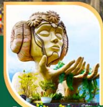
โมนาน้ำชาปากคาเฟ่