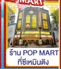
ร้าน POP MART ที่ซีเหมินติง