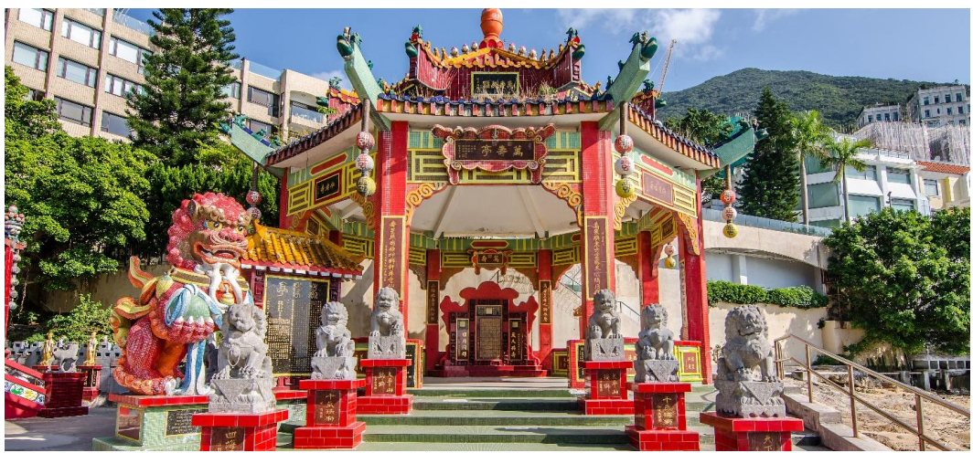
GO1HKG-TG001 อ่องกง เสริมดวงเศรษฐี เปิดท้องพระคลังเจ้าแม่กวนอิมอ่องฮ่า 4 วัน 3 คืน โดยสายการบิน Thai Airways (TG)

นำท่านเดินทางสู่ หาดรีพัลส์เบย์ (Repulse Bay) นำท่านขอพรเจ้าแม่กวนอิม หนึ่งในเทพที่ชาวฮ่องกงให้ความเคารพนับถืออย่างมาก ไม่ว่าจะขอพรสิ่งใดก็จะสมความปรารถนาทั้งสิ้น เริ่มต้นด้วยการ เดินเข้าวัดด้วยเท้าซ้าย และออกด้วยเท้าขวา เป็นเคล็ดลับที่ชาวฮ่องกง และคนจีนบอกว่าการเดินของเข้มนานาฟิกา ซึ่งจะทำให้ชีวิตเจริญก้าวหน้าขึ้นเอง ก่อนที่จะเดินเข้าวัดให้แวะเสริมดวงแห่งโชคลาภได้ด้วยการ ลูบลูกแก้วในปากสิงโตด้านหน้าวัด เพื่อให้มีแต่ความโชคดี หากเดินทางเข้ามาภายในวัดแล้วด้านซ้ายมือ จะเป็นที่ประดิษฐานเจ้าแม่กวนอิม และด้านขวามือ จะเป็นที่ประดิษฐานเจ้าแม่ทับทิม หรือเจ้าแม่ทินเห่า เชื่อว่าเป็นเทพแห่งท้องทะเลที่คอยปกป้องรักษาชาวประมงและยังเป็นเทพแห่งโชคลาภ สามารถขอพรกับเจ้าแม่กวนอิมปางประทานพร, ขอพรให้ป้องกันจากภัยอันตราย กับเจ้าแม่ทับทิม, ขอโชคลาภความมั่งคั่งกับเทพเจ้าไฉชิงเอี้ย, ขอลูกกับพระสังกัจจายน์โพธิสัตว์, เดินข้ามสะพานต่ออายุ, ขอพรเรื่องการเงิน และธุรกิจจากเหรียญเงินโบราณแห่งโชคลาภ และยังสามารถขอพรเทพเจ้าความรักได้ด้วย เรียกว่ามาที่เดียวได้ขอพรกันครบเลย ไม่ว่าจะใครจะขอพรอันใดก็สมหวัง สมความปรารถนาทุกประการ