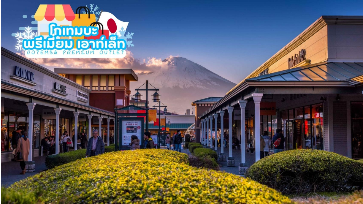
GO2NRT-TG062- TOKYO SNOW GRANDILLUMINATION 6D 4N

ช้อปปิ้งสินค้าแบรนด์เนม โทเทมบะ พรีเมียม เอาท์เล็ต (Gotemba Premium Outlet) เป็นหนึ่งในสาขาแบรนด์เอาท์เล็ตที่กระจายครอบคลุมประเทศญี่ปุ่น ให้ท่านได้ช้อปปิ้งอย่างจุใจกับสินค้าหลากหลายแบรนด์ดัง ทั้งในประเทศ และ ต่างประเทศ เช่น MORGAN, ELLE, BALLY, PRADA, GUCCI, DIESEL, TUMI, GAP, ARMANI, NIKE , ADIDAS ฯลฯ