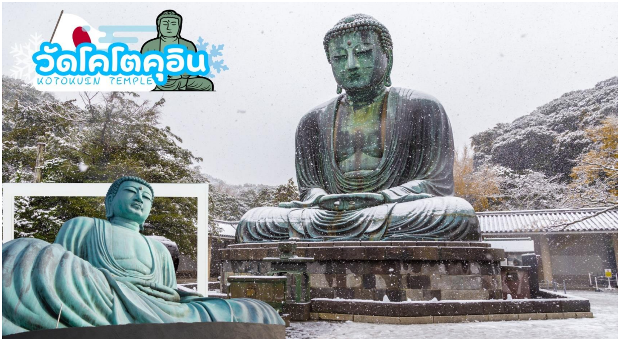
GO2NRT-TG062- TOKYO SNOW GRANDILLUMINATION 6D 4N

07.40 น. เดินทางถึง สนามบินนาริตะ ประเทศญี่ปุ่น (เวลาท้องถิ่นเร็วกว่าเวลาประเทศไทย 2 ชม.) ผ่านขั้นตอนการตรวจคนเข้าเมือง ด่านศุลกากร และรับกระเป๋าเรียบร้อยแล้ว [สำคัญมาก!!ไม่อนุญาตให้นำอาหารสด จำพวก เนื้อสัตว์ พืช ผัก ผลไม้ เข้าประเทศญี่ปุ่นหากฝ่าฝืนมีโทษจับปรับได้] เมืองคามาคุระ เป็นเมืองชายฝั่งเล็กๆในเขตจังหวัดคานากาวา(Kanagawa) ที่ดึงดูดเหล่านักท่องเที่ยวให้แวะมาเยี่ยมชม เย็น ถูกขนานนามให้เป็น “เกียวโตแห่งฝั่งตะวันออก” เพราะว่ามีทั้งวัดและศาลเจ้าอันเก่าแก่ อนุสรณ์สถานทางประวัติศาสตร์มากมาย นำท่านสักการะ “หลวงพ่โต” (Daibutsu) แห่งวัดโคโตคุอิน (Kotokuin Temple) เป็นรูปหล่อโลหะที่สูง 13.35 เมตรตั้งอยู่กลางลานวัด ใหญ่เป็นอันดับสองของประเทศญี่ปุ่น