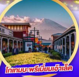
โททเทมบะ-พรีเมียเอ้าเล็ท

เดินทาง 14-19 ม.ค. 68 21-26 ม.ค. 68 28 ม.ค.-02 ก.พ. 68