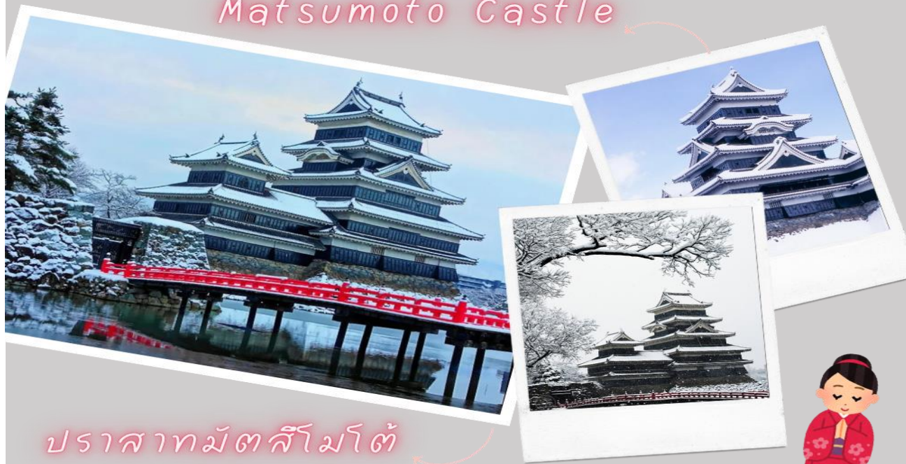
ปราสาทมัตสึโมโตะ