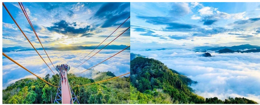
รวมค่าบริการรถขึ้น - ลง จุดจอดรถไปยังสกายวอล์ค ไม่รวมค่าถุงผ้าครอบรองเท้า 30 บาท (การเที่ยวชมทะเลหมอก อาจมีการสลับสับเปลี่ยนได้ ขึ้นอยู่กับสภาพอากาศ)

วันที่สาม สกายวอล์คชมทะเลหมอกอัยเยอร์เวง - สะพานแขวนแตปูซู - ล่องเรือเกาะทวด - บัตตานี - ศาลเจ้าแม่ลิ้มกอเหนี่ยว - บ้านขุนพิทักษ์รายาด้านนอก - หาดใหญ่ - ตลาดกิมหยง - สนามบินหาดใหญ่ - สนามบินดอนเมือง