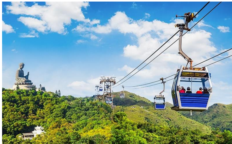
หน้าที่ 10 | ภาพประกอบใช้เพื่อการโฆษณาเท่านั้น

จากนั้นนำท่านเดินทางสู่ เกาะลันเตา นำท่านขึ้น กระเช้านองปิง 360 องศา (STANDARD CABIN) นำท่านนมัสการ พระใหญ่เทียนถาน ณ วัดโป่วหลิน หรือ นิยมเรียกว่าพระใหญ่ลันเตา องค์พระสร้างทองสัมฤทธิ์ 160 ชั้น องค์พระพุทธรูปหันพระพักตร์ไปทางเหนือสู่จีนแผ่นดินใหญ่ ประดิษฐานอยู่โดยมีความสูง 26.4 เมตรบนฐานดอกบัว หากนับรวมฐานแล้วมีความสูงทั้งสิ้น 34 เมตร ค่าก่อสร้างพระพุทธรูป 60 ล้านบาทเรียกช่องกง โดยพระพุทธรูปมีชื่อเรียกอย่างไม่เป็นทางการว่า พระใหญ่เทียนถาน ประดิษฐานบนแท่นบูชาที่มีความสูงเท่ากับตึก 3 ชั้นออกแบบตามฐานโครงสร้างของหอฟ้าเทียนถานในปักกิ่ง