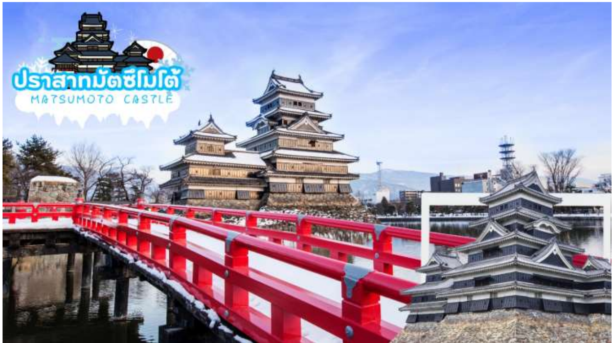
ปราสาทมัตซึโมโตะ MATSUMOTO CASTLE

เมืองโฮคุโตะ (Hokuto) ตั้งอยู่ทางตะวันตกเฉียงเหนือของจังหวัดยามานาชิ เป็นเมืองที่ล้อมรอบไปด้วยภูเขาสูง เช่น ภูเขาýtสี่งาตาเกะ เทือกเขาแอลป์ตอนใต้ ภูเขาคินปู และภูเขาคายะงาตาเกะ นอกจากนี้ยังสามารถเห็นวิวที่สวยงามของภูเขาไฟฟูจิได้อีกด้วยมีทรัพยากรธรรมชาติที่มีคุณภาพไม่ว่าจะเป็นน้ำแร่ เมล็ดข้าว และผลิตภัณฑ์จากนมวัว