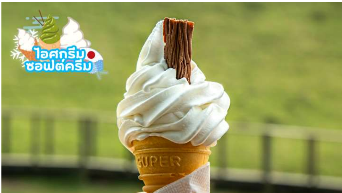
ไอศกรีม ซอฟต์ครีม

เมืองโฮคุโตะ (Hokuto) ตั้งอยู่ทางตะวันตกเฉียงเหนือของจังหวัดยามานาชิ เป็นเมืองที่ล้อมรอบไปด้วยภูเขาสูง เช่น ภูเขาýtสี่งาตาเกะ เทือกเขาแอลป์ตอนใต้ ภูเขาคินปู และภูเขาคายะงาตาเกะ นอกจากนี้ยังสามารถเห็นวิวที่สวยงามของภูเขาไฟฟูจิได้อีกด้วยมีทรัพยากรธรรมชาติที่มีคุณภาพไม่ว่าจะเป็นน้ำแร่ เมล็ดข้าว และผลิตภัณฑ์จากนมวัว