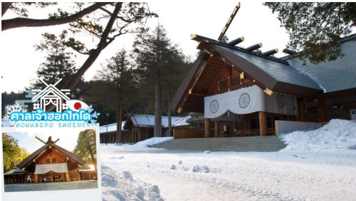
GO2CTS-XJ017-- HOKKAIDO HAKODATE SNOW LAND 7D 5N BY XJ

นำท่านมุ่งสู่ ศาลเจ้าฮอกไกโด (Hokkaido shrine) ศาลเจ้าแห่งนี้ตั้งอยู่ที่ซัปโปโร เป็นศาลเจ้าศาสนาพุทธนิกายชินโตถือเป็นศาลเจ้าที่มีความเก่าแก่แห่งหนึ่งในเกาะฮอกไกโด ถูกสร้างขึ้นในปี ค.ศ.1871 ในปัจจุบันก็ยังคงมีความเกี่ยวข้องกับวิถีชีวิตของชาวฮอกไกโดอย่างลึกซึ้ง เริ่มตั้งแต่การมาสักการะในวันปีใหม่ การปิดเป่ารั้วควาน วันเซ็ตสึบุน พิธีสมรสและอื่น ๆ เป็นต้น ในเขตศาลเจ้าที่มีธรรมชาติอุดมสมบูรณ์ มีกระรอกป่ามาเยี่ยมทักทาย