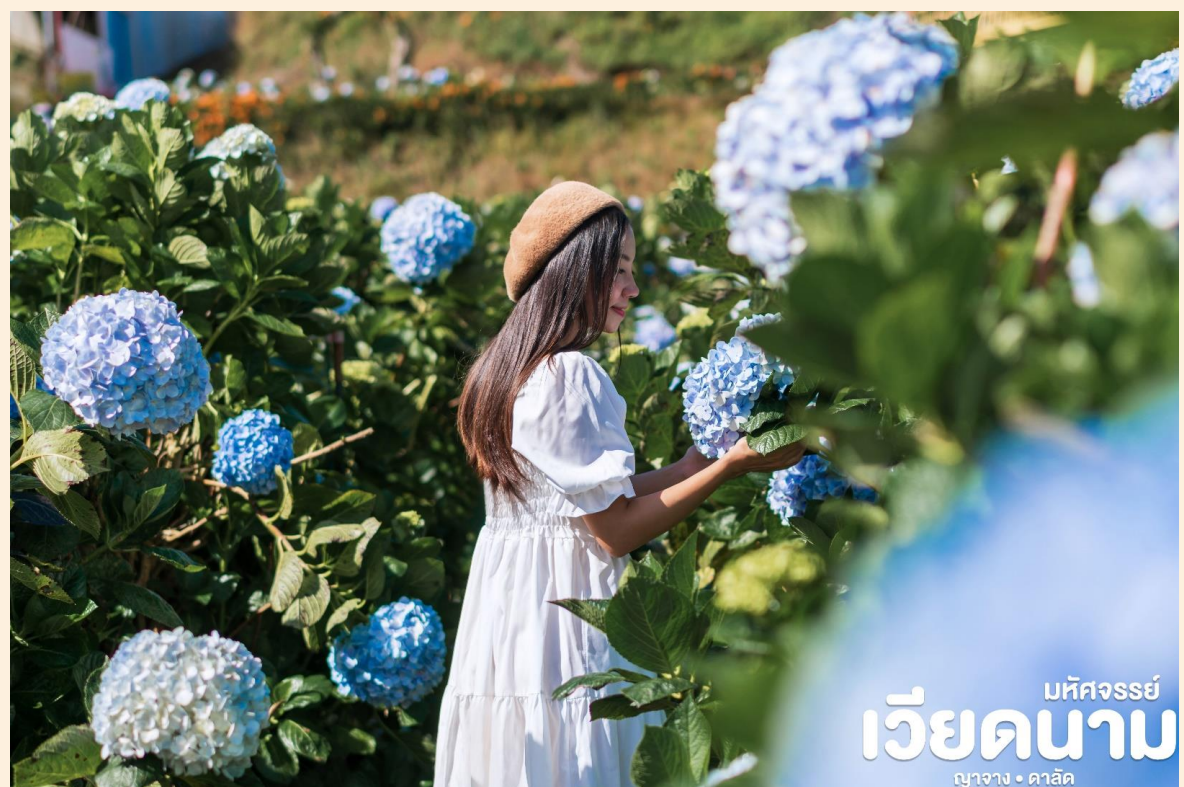
มัทจักรรย์ เวียดนาม ญางาง • ดาลัด

📍 นำท่าน ชมความสวยงามของ สวนดอกไม้ไฮเดรนเยีย ที่เบ่งบานอยู่เต็มพื้นที่ ซึ่งถือว่าสวนไฮเดรนเยียแห่งนี้เป็นที่ท่องเที่ยวอันดับต้นๆที่ดึงดูดนักท่องเที่ยวให้เดินทางมาเยี่ยมชมได้เป็นอย่างดี และให้ท่านเพลิดเพลินกับภาพความประทับใจตามอัธยาศัย