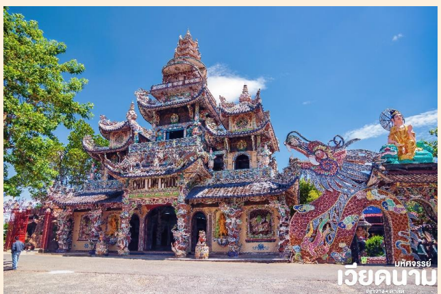
มัทจักรรย์ เวียดนาม ญางาง • ดาลัด

📍 จากนั้น นำท่านชม เจดีย์มังกร (Linh Phuoc Pagoda) “วัดลิงเฟือก” หรือดินแดนแห่งสวรรค์ เป็นวัดพุทธนิกายเซน ตกแต่งด้วยศิลปะจากเซรามิค วิหารด้านในสวยงามด้วยเซรามิคหลากหลายสี มีหอรระฆัง 7 ชั้นที่ถือว่าสูงที่สุดในเวียดนาม ผนังด้านบนมีภาพกิจกรรมฝาผนังเขียนพุทธประวัติของพระพุทธเจ้า ตั้งแต่ประสูติ ตรัสรู้ ปรีณิพพาน นอกจากนี้ยังมีเจ้าแม่กวนอิมปางยืนยกมือประทานพรที่ทำจากดอกกระดาษขนาดใหญ่ให้ชาวพุทธได้กราบไหว้อีกด้วย