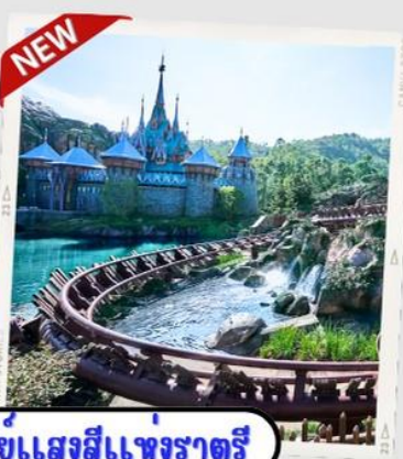
“MOMENTOUS” พห้ศจรรยแสงสีแพงราตรี