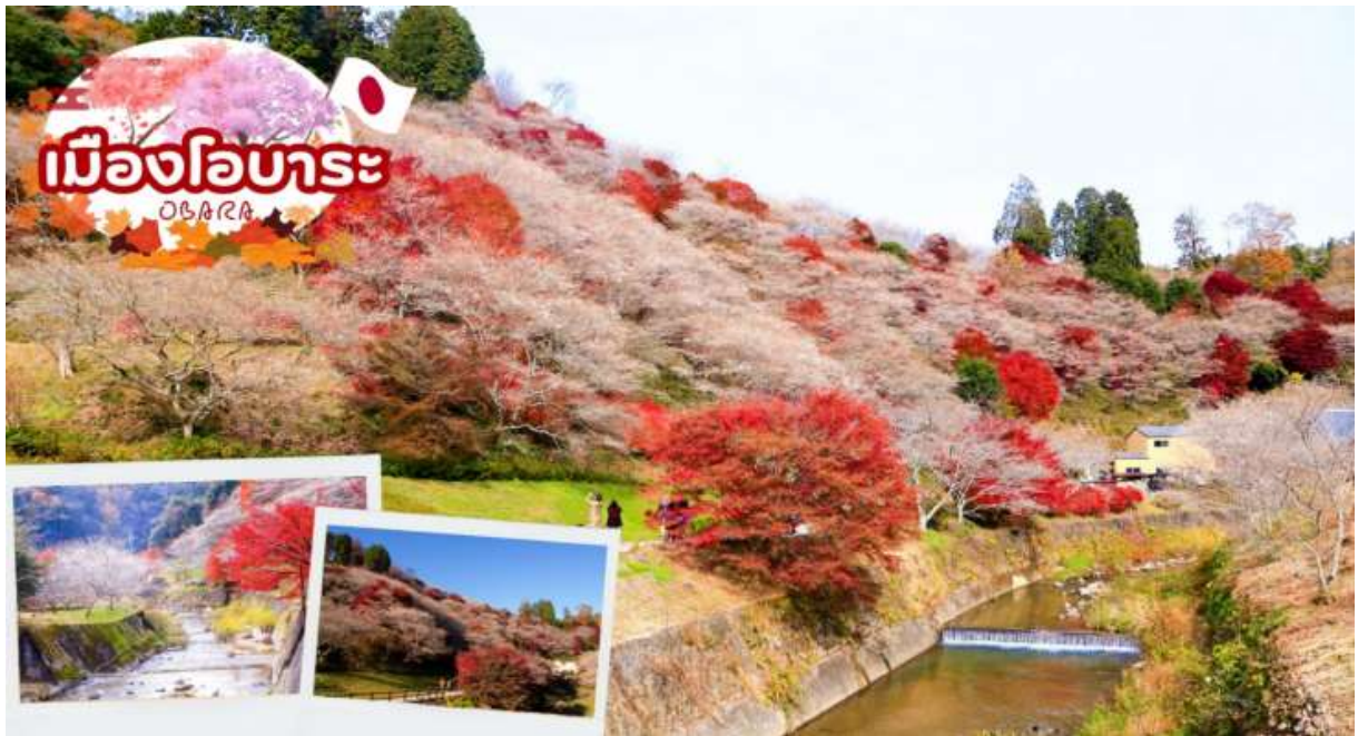
GO2NGO-TG033--AUTUMN KAMIKOCHI HAKUBA OBARA 7D 4N BY TG

เมืองโอบาระ นำท่านเดินทางชมความมหัศจรรย์ของธรรมชาติที่ ซากุระจะเบ่งบานพร้อมกับใบไม้เปลี่ยนสี (ขึ้นอยู่กับสภาพอากาศ) ซากุระพันธุ์นี้มีชื่อว่า ชิกิซากุระ (Shikizakura) เป็นซากุระสายพันธุ์ที่หายากมาก ๆ โดยมีความพิเศษที่แตกต่างจากซากุระทั่ว ๆ ไป คือ บาน 2 ครั้งต่อปี ดอกชิกิซากุระ (Shikizakura) จะเริ่มบานในช่วงกลางเดือนมีนาคมในฤดูใบไม้ผลิและจะบานอีกครั้งเดือนพฤศจิกายนในฤดูใบไม้ร่วง ใครที่พลาดชมซากุระในช่วงเดือนมีนาคมที่ผ่านมา สามารถมาชมความสวยงามของดอกซากุระในฤดูใบไม้เปลี่ยนสีเดือนพฤศจิกายนได้ที่นี่ ให้ท่านได้เพลิดเพลินกับความสวยงามของธรรมชาติตามอัธยาศัย