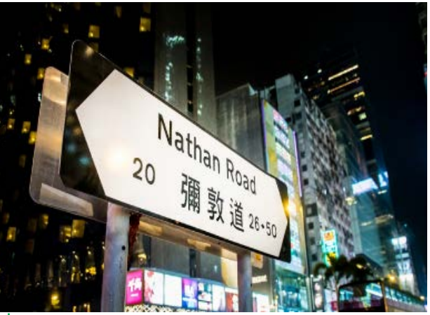
คำ อิศระอาหารค้ำเพื่อสะดวกในการท่องเที่ยว ณ ย่านจิมซาจ้ย

ได้เวลาอันสมควรนำท่านเดินทางสู่ ทำอากาศยานนานาชาติเซ็กแล้บก็อก