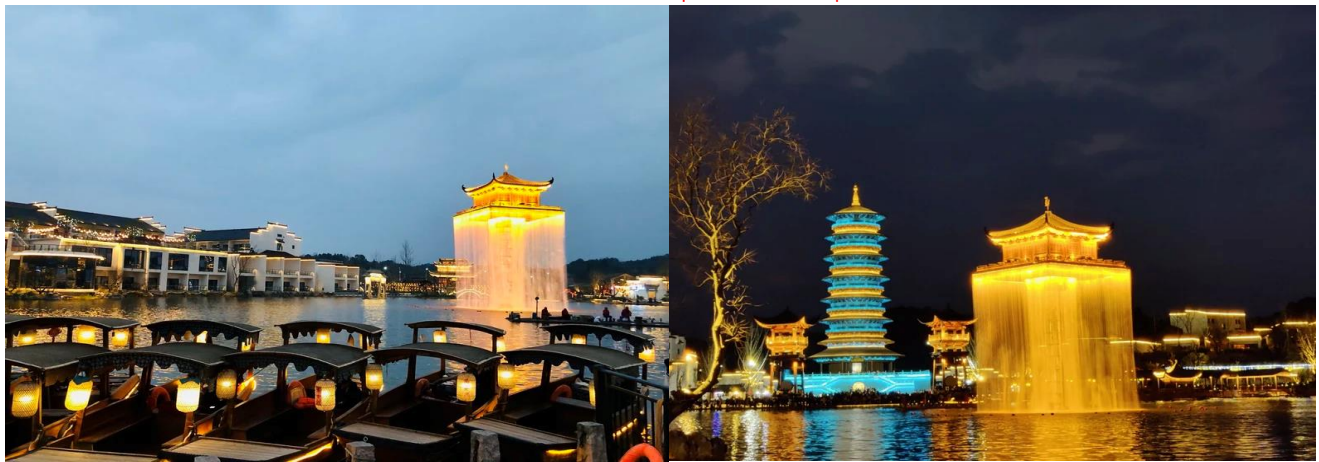
คำ รับประทานอาหาร ณ ร้านอาหาร นำทุกท่านเข้าสู่ที่พัก JIANGNAN HAOTING HOTEL ระดับ 4 ดาวท้องถิ่นหรือเทียบเท่า

ร้านอาหาร มากมายให้ท่านได้เดินเล่น และจุดถ่ายรูปอีกมากมายหลายจุด หมายเหตุ : โชว์จะหยุดแสดงช่วงหน้าหนาว ประมาณช่วงเดือน ปลายเดือนธันวาคม - กุมภาพันธ์ ของทุกปี (แจ้งวันปิดการแสดงอีกก่อนเดินทาง)