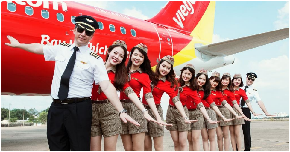
วันที่ห้า (5) สนามบินสุวรรณภูมิ กรุงเทพฯ

คำ รับประทานอาหารค่ำ ณ กัณฑ์ดาคร หมายเหตุ คณะควรเดินทางไปถึงสนามบินเพื่อทำการเช็คอินก่อนขึ้นเครื่องประมาณ 2-3 ชม. เพื่อหลีกเลี่ยงสถานการณ์ฉุกเฉินที่อาจเกิดขึ้น เช่น สภาพการจราจรที่คับคั่ง, สภาพอากาศและอื่นๆ โดยมีตัวแทนบริษัท(มัคคเทศก์, หัวหน้าทัวร์, คนขับรถ) เป็นผู้พิจารณาและบริหารเวลาอย่างเหมาะสม บริษัทขอสงวนสิทธิ์คืนเงินทุกกรณีหากลูกค้าไม่สามารถขึ้นเครื่องกลับตามวันและเวลาเที่ยวบินที่ระบุในรายการทัวร์. 23.30 น. ออกเดินทางจากจางซา โดยสายการบิน VIETJET (VZ) เที่ยวบินที่ VZ3605