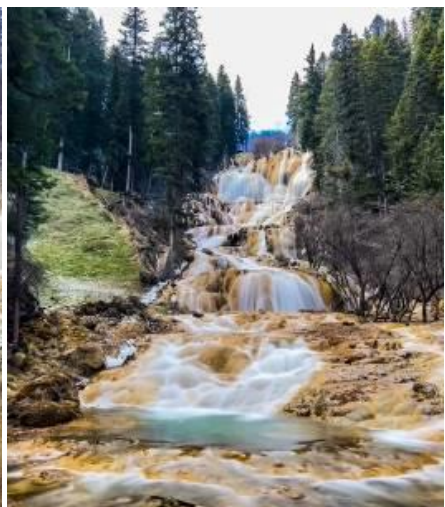
SBTTFU-SL003 เจิงตู จิวจ้ายโกว โหมวหนิโกว ภูเขาสี่ตรุณี (นั่งรถไฟความเร็วสูง) 6วัน 5คืน โดยสายการบิน Lion Air (SL)