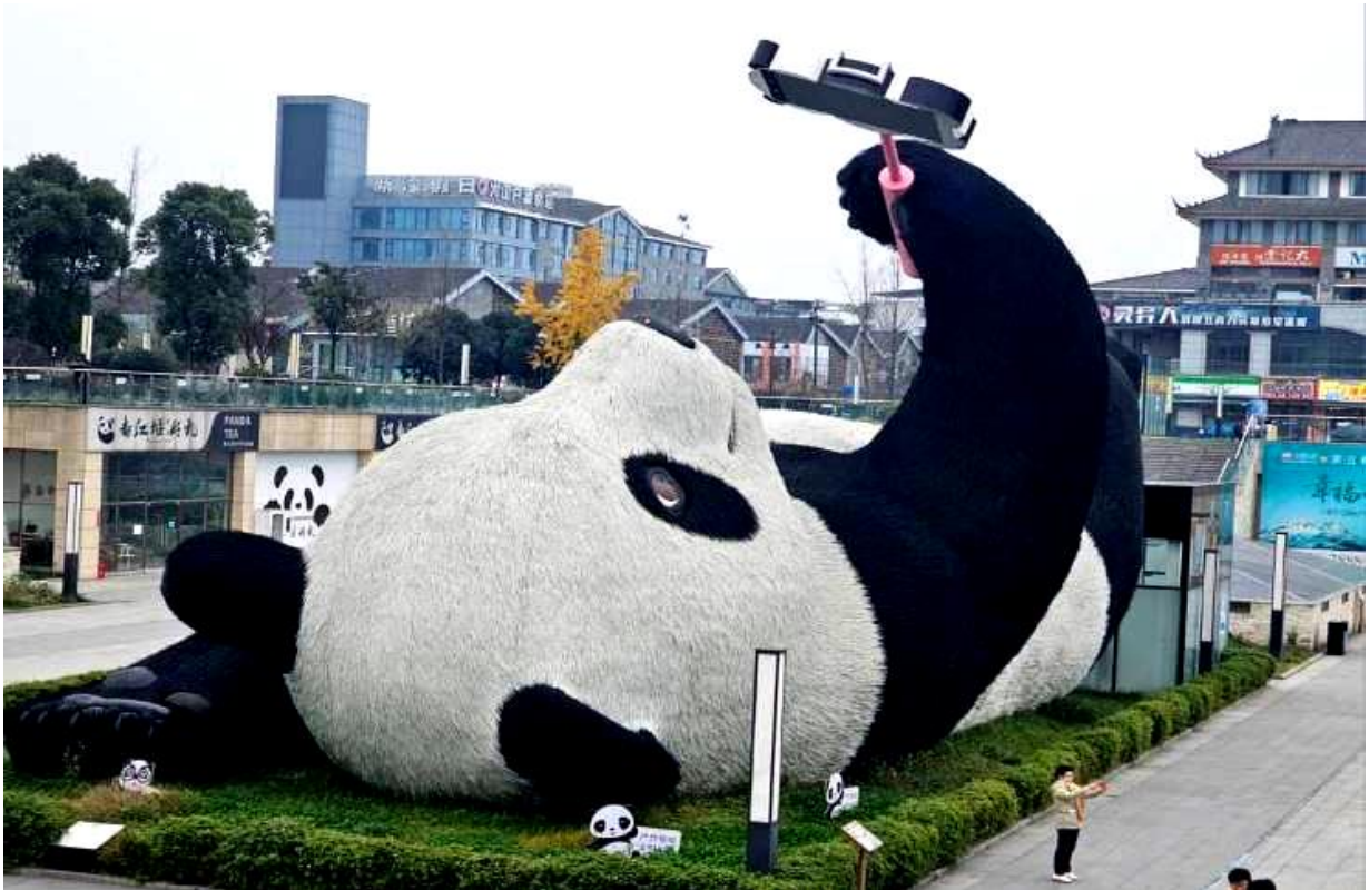
SBTTFU-SL003 เฉิงตู จิวจ้ายโกว โทมวหนี่โกว ภูเขาสี่ตรุณี (นั่งรถไฟความเร็วสูง) 6วัน 5คืน โดยสายการบิน Lion Air (SL)

จากนั้นนำท่านถ่ายกับรูปปั้นผลงานศิลปะ รูปแพนด้าถ่ายเซลฟี่ ที่ตั้งอยู่กลางจัตุรัสสุดน่ารัก ซึ่ง ออกแบบโดยนักออกแบบชื่อดัง Florentijn Hofman หมีแพนด้าตัวนี้มีความยาว 26 เมตร กว้าง 11 เมตร สูง 12 เมตรและหนัก 130 ตัน อยู่ในท่านอนหงายอยู่บนพื้น เท้ายกขึ้นจับไม้เซลฟี่สีชมพู เล่น ถ่ายเซลฟี่อย่างสบายอารมณ์ น่ารักน่าเอ็นดูมาก นักออกแบบ Hofman แนะนำว่าผลงานแพนด้ายักษ์ โทริศัพทมีชื่อเสียงขึ้นเพื่อถ่ายเซลฟี่มีความสุขมาก ด้วยท่าทางสบายๆ ผ่อนคลายและมีความสุข และ เป็นการแสดงออกด้วยภาษาทางศิลปะแบบหนึ่งที่น่าสนใจในชีวิตในท้องถิ่น มอบความรู้สึกสนิทสนมและ มีความสุขกับผู้ชมทุกท่าน