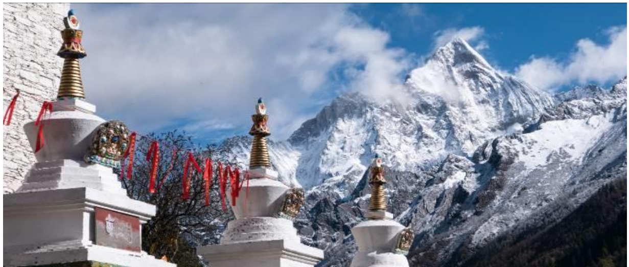
SBTTFU-SL003 เฉิงตู จิวจ้ายโกว โทมวหนี่โกว ภูเขาสีครุณี (นั่งรถไฟความเร็วสูง) 6วัน 5คืน โดยสายการบิน Lion Air (SL)

นำท่านเที่ยวชม หุบเขาซวงเฉียวโกว เป็นจุดวิวทิวทัศน์ที่สวยงามที่สุด ชมความงามธรรมชาติของซวงเฉียวโกว(ลำน้ำสองสะพาน) ธารน้ำมีความยาว 35 กิโลเมตร มีทิวทัศน์ของภูเขาเป็นหลัก, ลำธารผ่านจุดต่างๆที่เป็นจุดทิวทัศน์ ไม่ว่าจะเป็น ซานกัวจวง, เขาหนิวซิน, เย่เหรินเฟิง ถือเป็นจุดท่องเที่ยวแห่งหนึ่งของเขาสีครุณีที่รวบรวมจุดสำคัญหลายๆอย่างเข้าด้วยกันไว้ ชมไฮไลท์จุดชมวิว ได้แก่ ชมหุบเขาหยินหยาง ทุ่งต้นหยาง แล้วเดินทางเข้าสู่ส่วนลึกสุด ท่านจะได้เห็นธารน้ำแข็ง ภูเขากระจกแก้ว ภูเขาดวงอาทิตย์ ภูเขาดวงจันทร์ ยอดเขากระต่ายทะเลสาบ และ ทุ่งหญ้าเหนียนหญูป้า