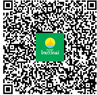
รายละเอียดกรมธรรม์ไทยวิวัฒน์

SBTYCU-ZH001 - บินตรงหุนเฉิง ซีอาน ลั่วหยาง 6 วัน 5 คืน โดยสายการบิน เซินเจิ้น แอร์ไลน์ (ZH)