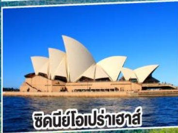
ซิดนีย์โอเปร่าเฮาส์