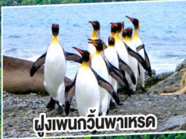
ฝูงเพนกวินพาทรด