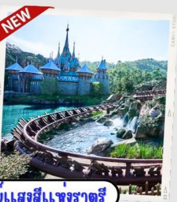
“MOMENTOUS” พห้ศจรรบแสดงสีแ่งรাত্রี