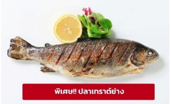
พิเศษ!! ปลาเทราต์ย่าง

เที่ยง ๑๑ รับประทานอาหารกลางวัน (มื้อที่3) เมนูพิเศษ ปลาเทราต์ย่าง ท่านละ 1 ตัว นำท่านเดินทางสู่ เมืองมิวนิก (Munich) ประเทศเยอรมัน (ระยะทาง 209 กม./ 3 ชม.) เป็นหนึ่งในเมืองมั่งคั่งที่สุดของยุโรป มีพรมแดนติดเทือกเขาแอลป์ พาทุกท่านไปเช็คอินสถานที่ชื่อดังที่มีความสำคัญของเมืองมิวนิก