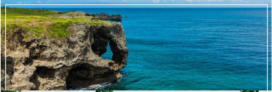
CAPE MANZAMO ผามันซาโมะ

เที่ยง รับประทานอาหารกลางวัน ณ กัดดาการ (2)