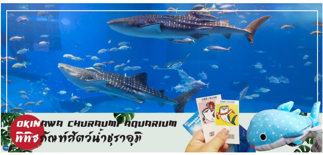
OKINAWA CHURAUMI AQUARIUM พิพิธภัณฑ์สัตว์น้ำชुरาอุมิ

เช้า รับประทานอาหารเช้า ณ ห้องอาหารของโรงแรม (1) นำท่านชม พิพิธภัณฑ์สัตว์น้ำชुरาอุมิ (OKINAWA CHURAUMI AQUARIUM) (ใช้เวลาเดินทางประมาณ 1.40 ชั่วโมง) เป็นพิพิธภัณฑ์สัตว์น้ำที่ดีที่สุดในประเทศญี่ปุ่น ไฮไลท์!!! ของการเยี่ยมชมพิพิธภัณฑ์สัตว์น้ำแห่งนี้คือแห่งก้นาคูโรชิโอะ ซึ่งเป็นหนึ่งใน แห่งน้ำที่ใหญ่ที่สุดของโลก ซึ่งภายในนั้นเต็มไปด้วยสิ่งมีชีวิตในทะเลแถบโอกินาวาที่หลากหลาย สัตว์น้ำที่โดดเด่นที่สุดคือฉลามวาฬยักษ์ และกระเบนราหู อีสระให้ท่านได้เพลิดเพลินกับสัตว์น้ำหลากหลายชนิด ทั้ง ปลาตาว ฉลาม ฉลามเสือ และฉลามวัว ปลาเรืองแสง ตลอดจนหอยต่างๆ นอกจากนี้ยังมีสะพานน้ำกลางแจ้งที่ตั้งอยู่ใกล้ริมน้ำซึ่งเป็นที่จัดการแสดงของโลมาแสนรู้ เต่าทะเล และพะยูน ที่จัดขึ้นเพียงไม่กี่ครั้งต่อวัน (ไม่มีค่าใช้จ่ายเพิ่มเติม แต่ต้องตรวจสอบเวลาการแสดงก่อนชมนะคะ)