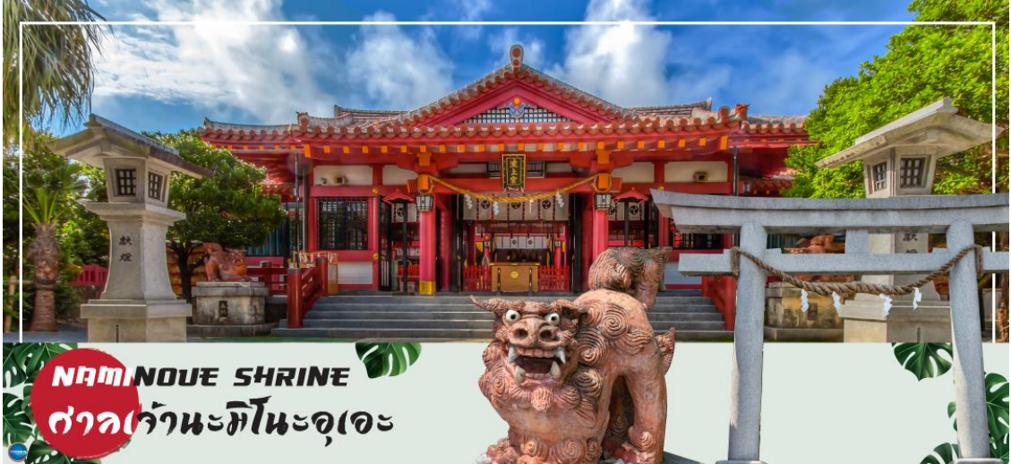
NAMINOUE SHRINE ศาลเจ้าคามิโนะอุเอะ

เช้า รับประทานอาหารเช้า ณ ห้องอาหารของโรงแรม (5) นำท่านเดินทางสู่ ศาลเจ้าคามิโนะอุเอะ (Naminoue Shrine) (ใช้เวลาเดินทางประมาณ 10 นาที) ตั้งอยู่ ณ บริเวณที่เป็นพื้นที่ศักดิ์สิทธิ์ที่ใช้ในการสวดภาวนาอธิษฐานต่อเทพเจ้าที่สถิตย์อยู่ ณ อาคารจักรเจ้าสมุทรโพ้นทะเลมาแต่ครั้งโบราณ ในอดีตชาวเรือที่เข้าออก ณ ท่าเรือนาสะ (Naha Port) ซึ่งขณะนั้นเป็นศูนย์กลางการแลกเปลี่ยนค้าขายกับนานาประเทศ ทั้งจีน ประเทศทางตอนใต้ เกาหลี และชวยามาโดะ มักจะแหงนหน้ามองขึ้นไปยังศาลเจ้าซึ่งตั้งอยู่บนหน้าผาสูงเพื่ออธิษฐาน และแสดงความขอบคุณ ศาลเจ้าคามิโนะอุเอะได้รับความเสียหายจากการรบในโอกินาวะ (Battle of Okinawa) เมื่อครั้งสงครามแปซิฟิก แต่ได้รับการบูรณะฟื้นฟูในเวลาต่อมาเมื่อสงครามสิ้นสุดลง ปัจจุบันนี้ได้กลายมาเป็นศูนย์กลางแห่งศาสนาชินโตในจังหวัดโอกินาวะ ชาวญี่ปุ่นมักจะมาไหว้ขอพรเกี่ยวกับธุรกิจการงานให้เจริญรุ่งเรือง ร่ำรวย และมาสะเดาะเคราะห์ให้พ้นโชคร้าย จากนั้นนำท่านสู่ เอาท์เล็ตมอลล์ อาชิบิน่า (Okinawa Outlet Mall Ashibinaa) (ใช้เวลาเดินทางประมาณ 30 นาที) เอาท์เล็ตแห่งแรกในโอกินาวะ รวบรวมร้านค้าชั้นนำกว่า 100 ร้าน ทั้งเสื้อผ้าแฟชั่น สินค้าแบรนด์เนม นาฬิกา ข้าวของเครื่องใช้ ของเล่น ทุกร้านจัดเต็มทั้งสินค้ารุ่นเก่าและรุ่นใหม่ ลดราคากระหน่ำกว่า 30-80% ให้ได้เดินช้อปปิ้งตัดท้ายทริปกันอย่างจุใจ ภายใต้บรรยากาศสบายๆ สโลว์ไลฟ์พรีเมียมทะเล หากข้อปจนเหนื่อยสามารถขึ้นไปทานอาหารที่ชั้น 2 มีอีกหลายร้านที่คอยให้บริการ