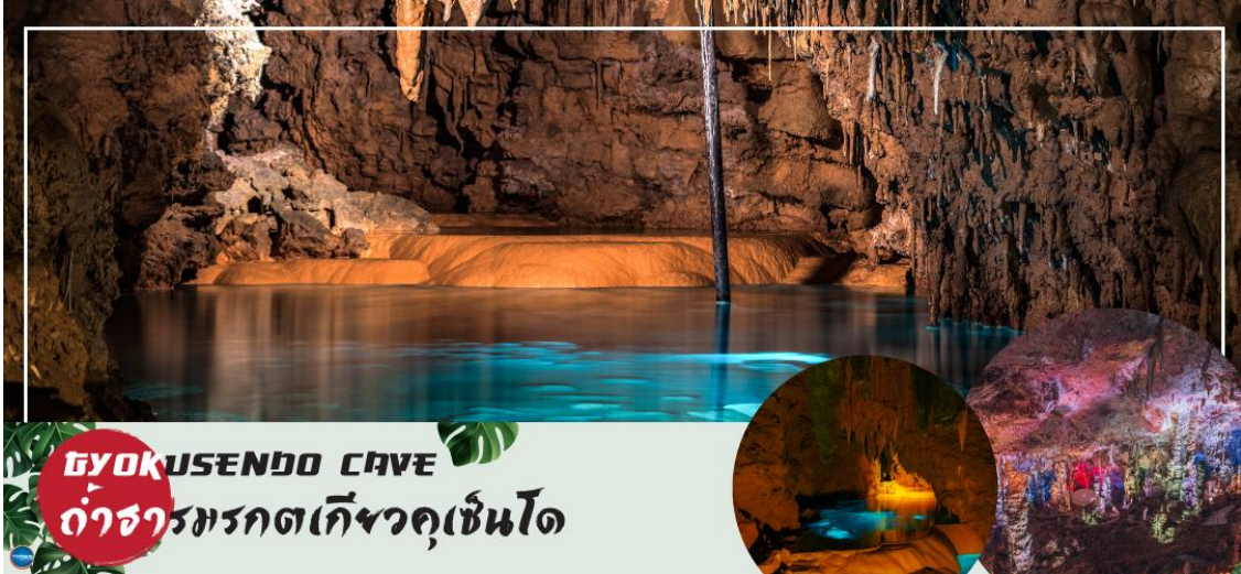
GYOKUSENDO CAVE ถ้ำธารมรกตเก็ซวูกุเซินโด

ไม่ได้ใช้แบบขึ้นรูป มีสีสันสดใส ด้วยฝีมือช่างผู้ชำนาญ ชมช่างทำแก้ว ในขณะที่ทำงานสร้างเครื่องแก้ว ที่เป็นการสร้างสรรค์ด้วยฝีมือของช่างแต่ละคน ชมห้องจัดแสดงผลงานเครื่องแก้ว และให้ท่านสามารถเลือกซื้อเครื่องแก้วที่ท่านถูกใจได้