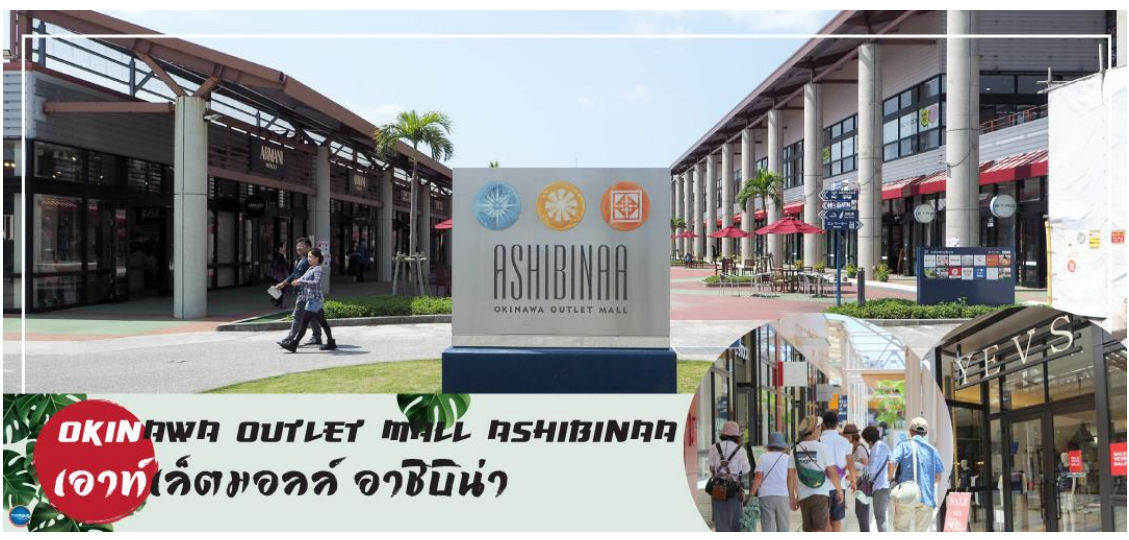
OKINAWA OUTLET MALL ASHIBINAA เอาท์เล็ตมอลล์ อาชิบิน่า

เช้า รับประทานอาหารเช้า ณ ห้องอาหารของโรงแรม (5) นำท่านเดินทางสู่ ศาลเจ้าคามิโนะอุเอะ (Naminoue Shrine) (ใช้เวลาเดินทางประมาณ 10 นาที) ตั้งอยู่ ณ บริเวณที่เป็นพื้นที่ศักดิ์สิทธิ์ที่ใช้ในการสวดภาวนาอธิษฐานต่อเทพเจ้าที่สถิตย์อยู่ ณ อาคารจักรเจ้าสมุทรโพ้นทะเลมาแต่ครั้งโบราณ ในอดีตชาวเรือที่เข้าออก ณ ท่าเรือนาสะ (Naha Port) ซึ่งขณะนั้นเป็นศูนย์กลางการแลกเปลี่ยนค้าขายกับนานาประเทศ ทั้งจีน ประเทศทางตอนใต้ เกาหลี และชวยามาโดะ มักจะแหงนหน้ามองขึ้นไปยังศาลเจ้าซึ่งตั้งอยู่บนหน้าผาสูงเพื่ออธิษฐาน และแสดงความขอบคุณ ศาลเจ้าคามิโนะอุเอะได้รับความเสียหายจากการรบในโอกินาวะ (Battle of Okinawa) เมื่อครั้งสงครามแปซิฟิก แต่ได้รับการบูรณะฟื้นฟูในเวลาต่อมาเมื่อสงครามสิ้นสุดลง ปัจจุบันนี้ได้กลายมาเป็นศูนย์กลางแห่งศาสนาชินโตในจังหวัดโอกินาวะ ชาวญี่ปุ่นมักจะมาไหว้ขอพรเกี่ยวกับธุรกิจการงานให้เจริญรุ่งเรือง ร่ำรวย และมาสะเดาะเคราะห์ให้พ้นโชคร้าย จากนั้นนำท่านสู่ เอาท์เล็ตมอลล์ อาชิบิน่า (Okinawa Outlet Mall Ashibinaa) (ใช้เวลาเดินทางประมาณ 30 นาที) เอาท์เล็ตแห่งแรกในโอกินาวะ รวบรวมร้านค้าชั้นนำกว่า 100 ร้าน ทั้งเสื้อผ้าแฟชั่น สินค้าแบรนด์เนม นาฬิกา ข้าวของเครื่องใช้ ของเล่น ทุกร้านจัดเต็มทั้งสินค้ารุ่นเก่าและรุ่นใหม่ ลดราคากระหน่ำกว่า 30-80% ให้ได้เดินช้อปปิ้งตัดท้ายทริปกันอย่างจุใจ ภายใต้บรรยากาศสบายๆ สโลว์ไลฟ์พรีเมียมทะเล หากข้อปจนเหนื่อยสามารถขึ้นไปทานอาหารที่ชั้น 2 มีอีกหลายร้านที่คอยให้บริการ