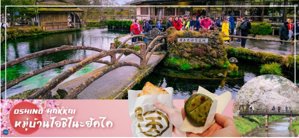
OSHINO HAKKAI หมู่บ้านโอชิโนะฮัคไค

ได้เวลาอันสมควรนำท่านเดินทางสู่ จังหวัดยามานาชิ (Yamanashi) (ใช้เวลาเดินทางประมาณ 2 ชั่วโมง) จากนั้นนำท่านเดินทางสู่ หมู่บ้านโอชิโนะฮัคไค (Oshino Hakkai) ให้ท่านเจาะลึกตาม หาแหล่งน้ำบริสุทธิ์จากภูเขาไฟฟูจิ ที่เป็นแหล่งน้ำตามธรรมชาติตั้งอยู่ในหมู่บ้านโอชิโนะ จ.ยามานาชิ หรือพูดในทางกลับกันคือกลุ่มน้ำผุดโอชิโนะฮัคไค เพียงก้าวแรกที่ย่างเท้าเข้าไปในหมู่บ้านก็สัมผัส ได้ถึงอากาศบริสุทธิ์ และไอเย็นจากแหล่งน้ำธรรมชาติที่มีให้เห็นอยู่ทุกมุม โดยในบ่อน้ำใสแจ๋วมีปลา หลากหลายพันธุ์แหวกว่ายอย่างสบายอารมณ์ แต่ขอบอกเลยว่าน้ำแต่ละบ่อนั้นเย็นจับใจจน แอมสั่งสั่งว่าน้องปลาไม่หนาวสะท้านกันบ้างหรือ เพราะอุณหภูมิในน้ำเฉลี่ยอยู่ที่ 10-12 องศา เซลเซียสนอกจากชมแล้วก็ยังมือน้ำผุดจากธรรมชาติให้ดื่กดื่มตามอัธยาศัย และที่สำคัญ หมู่บ้านโอชิ โนะยังเป็นแหล่งช้อปปิ้งสินค้าโอท็อปชั้นเยี่ยมอีกด้วย นำท่านเข้าสู่ที่พัก (ใช้เวลาเดินทางประมาณ 20 นาที)