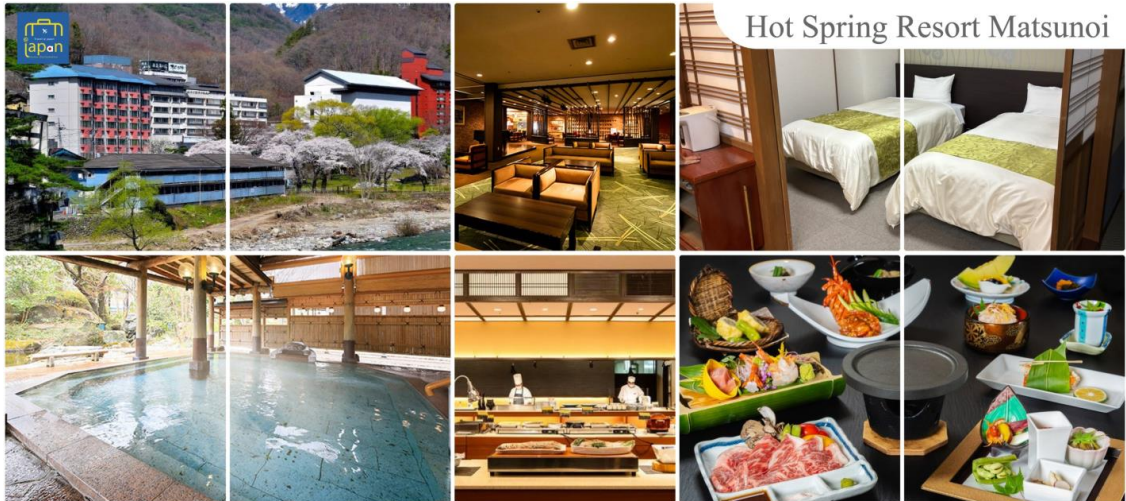
Hot Spring Resort Matsunoi

พักที่ HOT SPRING RESORT MATSUNOI หรือระดับเดียวกัน ค่า รับประทานอาหารค่ำ ณ ภัตตาคาร ของโรงแรม (5) --- บุฟเฟต์นานาชาติ หลังอาหารให้ท่านได้ผ่อนคลายกับการแช่น้ำแร่ธรรมชาติ เชื่อว่าถ้าได้แช่น้ำแร่แล้ว จะทำให้ ผิวพรรณสวยงามและช่วยให้ระบบหมุนเวียนโลหิตดีขึ้น