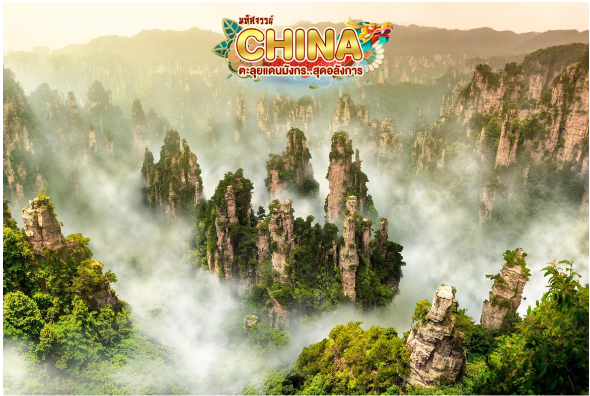
OPTION: สะพานแก้วข้ามหุบเขา แกรนด์แคนยอน อุทยานจางเจียเจีย

จากนั้น เที่ยวชม เขตนุรักษ์ธรรมชาติเทียนจื่อชาน เป็นเขตป่าอนุรักษ์ต่อเนื่องมาจากทางด้านทิศเหนือของอุทยานแห่งชาติจางเจียเจีย มีอากาศเย็นสบายตลอดทั้งปี และมีจุดชมวิวที่สามารถมองเห็นยอดเขาน้อยใหญ่นับมากกว่าร้อยยอด ชมทิวทัศน์ที่สวยงามของ สะพานอันดับหนึ่งไต้ฟ้า (เทียนเสี้ยต้อ้อเฉียว) เคยเป็นสถานที่ถ่ายทำภาพยนตร์ชื่อดังหลายเรื่อง ตื่นตาตื่นใจไปกับทิวทัศน์ธรรมชาติที่สวยงามแสนประทับใจ ลงโดยลิฟท์แก้วไปหลงที่จุดที่สูงที่สุด 326 เมตร นำท่านสู่ดินแดนมรดกโลกทางธรรมชาติของจีน ภูเขาฮัลเลอญาท์ ที่ทุกคนคุ้นตากันดีจากภาพยนตร์ชื่อดัง "อวตาร" ระหว่างทางผ่านชมขุนเขาอันน้อยใหญ่ สองข้างทางเขียวชะอุ่มไปด้วยต้นไม้ขนาดพันธุ์ (รวมค่าลิฟท์ ขึ้น-ลง)