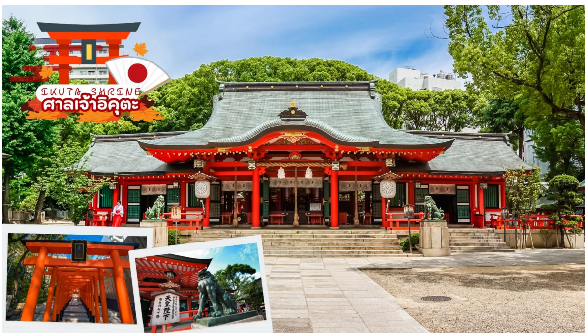
GO2KIX-TG0009--AUTUMN AND WINTER IN KANSAI 6D4N BY TG

นำท่านขอพรความรัก ศาลเจ้าอิคุตะ ตั้งอยู่ใจกลางเมืองโกเบ มีประวัติความเป็นมายาวนานกว่า 1800 ปี มีเทพเจ้าแห่งสายสัมพันธ์อยู่ ภายในเขตวัดนอกจากศาลเจ้าหลักแล้วยังมีศาลเจ้าเล็กๆ อยู่อีกมากมาย หนึ่งในเสน่ห์ของศาลเจ้านี้ก็คืออิคุตะโนะโมริที่เต็มไปด้วยสีเขียว