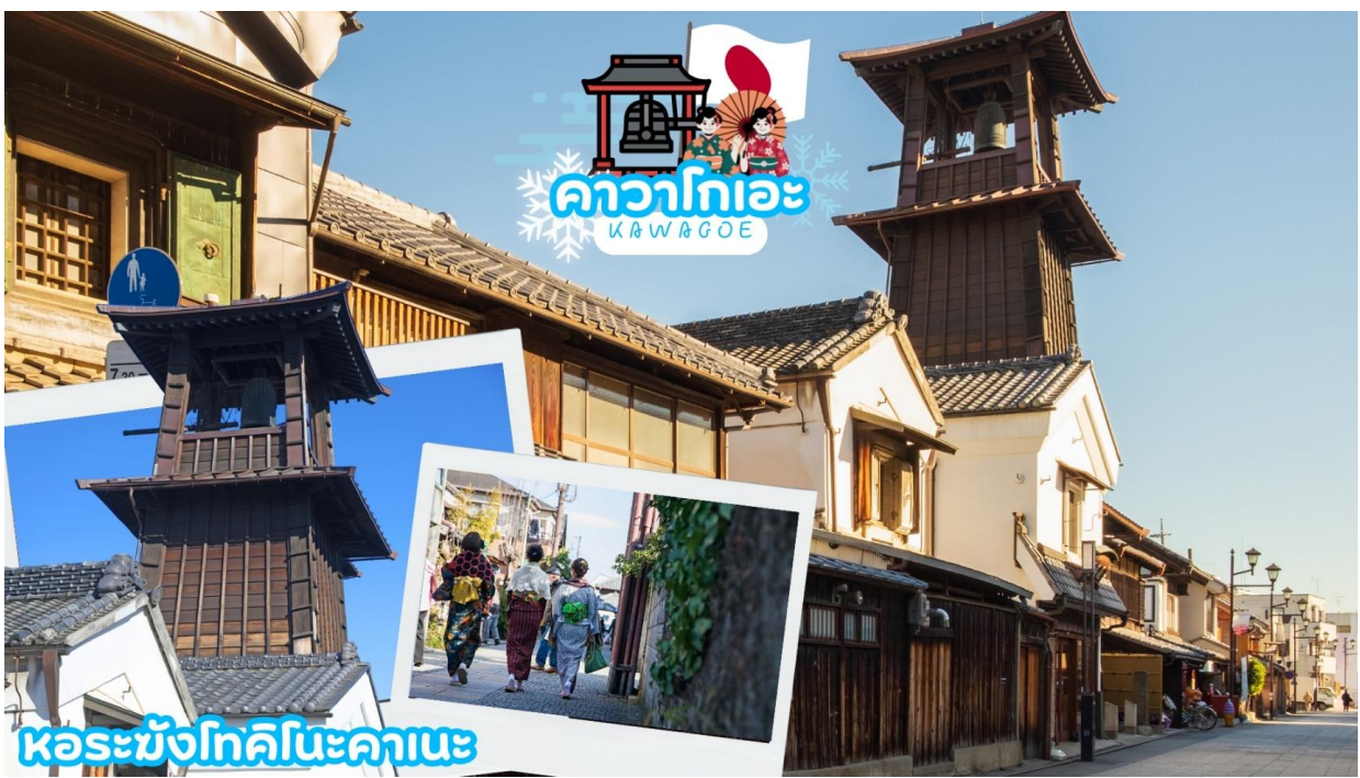
GO2NRT-TG058- TOKYO FUJI KAMAKURA WINTER LIGHT UP 6D 4N

07.40 น. เดินทางถึง สนามบินนาริตะ ประเทศญี่ปุ่น (เวลาท้องถิ่นเร็วกว่าเวลาประเทศไทย 2 ชม.) ผ่านขั้นตอนการตรวจคนเข้าเมือง ดำเนินศุลกากร และรับกระเป๋าเรียบร้อยแล้ว [สำคัญมาก!!ไม่อนุญาตให้นำอาหารสด จำพวก เนื้อสัตว์ พืช ผัก ผลไม้ เข้าประเทศญี่ปุ่นหากฝ่าฝืนมีโทษจับปรับได้] เดินทางสู่ คาวาโกเอะ (Kawagoe) ได้รับการขนานนามว่าเป็นลิตเติลเอโดะ เพราะมีบรรยากาศที่มีความเป็นเมืองเก่าที่ได้กลิ่นอายโบราณทำให้รู้สึกเหมือนได้ย้อนยุค ได้สัมผัสบรรยากาศของโกดังเก่า ที่เรียงรายกันยาวตลอดระยะทางกว่า 700 เมตร ในสมัยก่อนเป็นสถานที่เก็บกักเสบียงอาหารเพื่อส่งไปให้เมืองเอโดะ (โตเกียวในปัจจุบัน) แต่ในปัจจุบันได้ถูกเปลี่ยนเป็นร้านค้า ร้านอาหาร ร้านขายของที่ระลึก ไม่ว่าจะเป็นร้านขนมที่ทำจากมันหวานสีเหลืองและสีม่วงอันเป็นผลิตภัณฑ์ขึ้นชื่อของเมืองนี้ สถานที่ท่องเที่ยวอันมีชื่อเสียงของเมืองคาวาโกเอะ