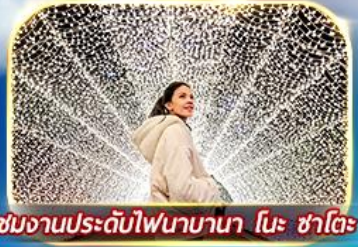
ชมงานประดับไฟนาบามา โมะ ซาโตะ