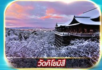
วัดคิโยมิตสึ