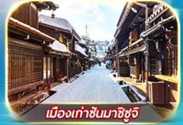
เมืองเก่าซันมาชิซุจิ