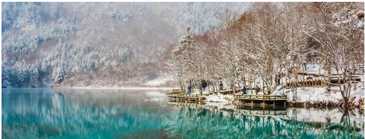
GO1TFU-MU011 Snow Winter เฉิงตู ดูหมีแพนด้า ภูเขาหิมะกลาเซียร์ท่ากู่ปิงชว่น (นั่งรถไฟความเร็วสูง) 6วัน 5คืน *ไม่ลงร้านช้อปปิ้ง* โดยสายการบิน China Eastern (MU)

ทะเลสาบแรด เป็นทะเลสาบขนาดใหญ่อันดับ 2 ของอุทยานจิวจ้ายโกว รองจากทะเลสาบยาว และเป็นทะเลสาบที่มีวิวเปลี่ยนเยอะที่สุด เงาสะท้อนสวยงามอันดับ 1 รอบทะเลสาบเต็มไปด้วยดอกไม้ นานาชนิด ถูไ้ไปไม้ผลึกกับฤดูร้อนจะเป็นสีเขียวทั้งหมด ถูไ้ไปไม้ร่วง ใบไม้จะเป็นสีแดง ส่วนต้นสนจะเป็นสีเขียว สองเงาสะท้อนน้ำยิ่งสวยงาม