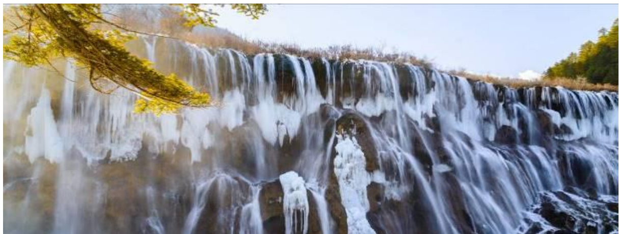
GO1TFU-MU011 Snow Winter เฉิงตู ดูหมีแพนด้า ภูเขาหิมะกลาเซียร์ท่ากู่ปิงชว่น (นั่งรถไฟความเร็วสูง) 6วัน 5คืน *ไม่ลงร้านช้อปปิ้ง* โดยสายการบิน China Eastern (MU)

น้ำตกธารไข่มุก ซึ่งเป็นน้ำตกที่ไหลผ่านถ้ำลำธารใหญ่น้อยที่สลับซับซ้อนดุจดังวังบาดาล โดยมีสายน้ำทอดยาวลดหลั่นกันมาเป็นระยะทางถึง 310 เมตร โดยไม่ขาดช่วงสายธารส่องประกายระยิบระยับราวกับความงามของเส้นไข่มุก ให้ท่านได้สนุกกับการบันทึกถ่ายภาพและดื่มด่ำกับธรรมชาติที่สวยงามได้อย่างเต็มที่ ถึงเวลานัดหมายออกจากอุทยาน