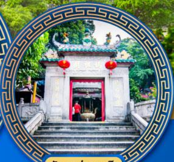
วัดอามา มาเก๊า