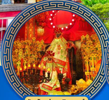
วัดเจ้าแม่กวนอิมฮ่องฮำ