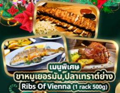
เมนูพิเศษ ขามูเยอรมัน, ปลาเทราต์ย่าง Ribs Of Vienna (1 rack 500g)

สัมพัสบรรยากาศตลาดคริสต์มาสยุโรป ชมความอลังการ ปราสาทนอยชวานสไตน์ เยือนมิวนิก จัตุรัสมาเรียนพลัทซ์ สัมพัสมืองมรดกโลก เซสกี คุมลอฟ ปราสาทบราติสลาว่า ล่องเรือชมความงามแม่น้ำดานูบ ชมความน่าหลงใหลของ ปราสาทบูดาเปสต์ ชมเมืองอัลส์สตัดท์ หมู่บ้านริมทะเลสาบ พระราชวังเซินบรุนน์ สวนมิราเบล ซ้อปปีงเอาท์เล็กสินค้าแบรนด์เนม