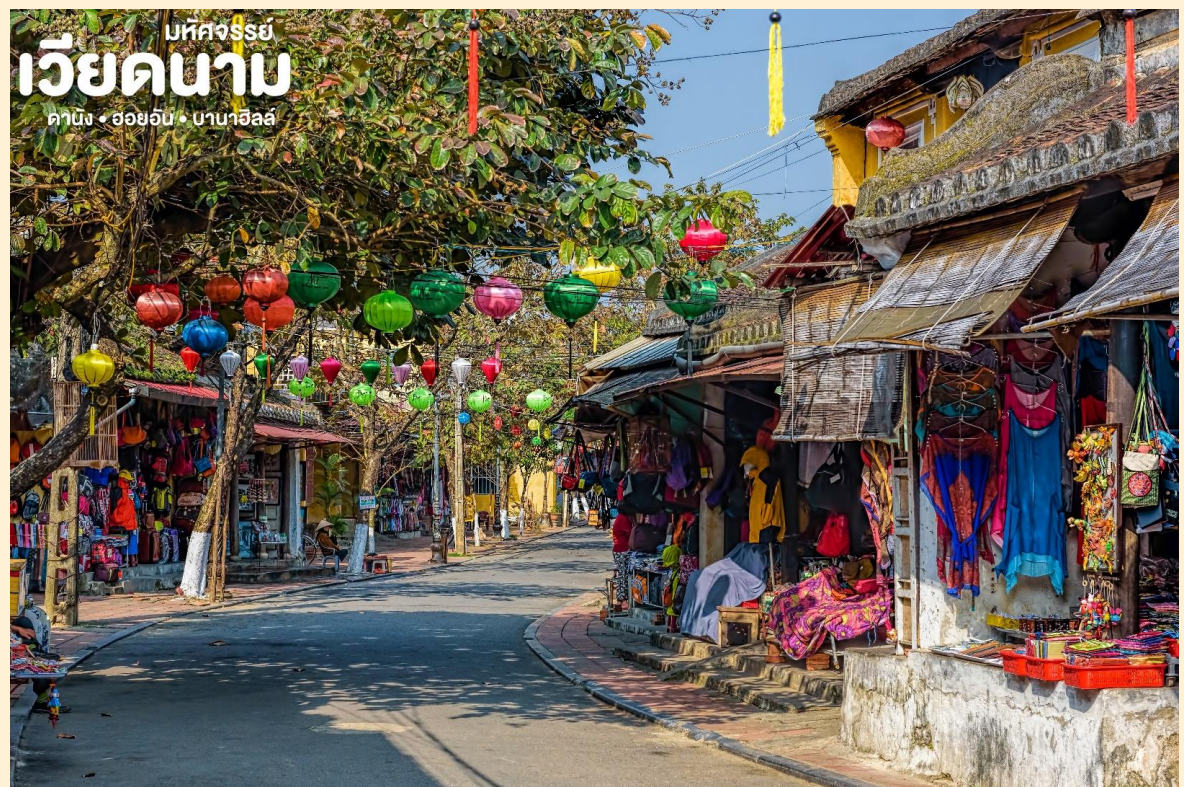
บทควรรษ์ เวียดนาม คาบิง • ฮอยอัน • บานาฮิลล์

จากนั้น นำท่านเดินทางสู่ “เมืองโบราณฮอยอัน” (Hoi An) เมืองฮอยอันนั้นอดีตเคยเป็นเมืองท่า การค้าที่สำคัญแห่งหนึ่งในเอเชียตะวันออกเฉียงใต้และเป็นศูนย์กลางของการ แลกเปลี่ยนวัฒนธรรม ระหว่างตะวันตกกับตะวันออกองค์การยูเนสโกได้ประกาศให้ฮอยอันเป็นเมืองมรดกโลกทาง วัฒนธรรมเนื่องจากเป็นสถานที่สำคัญทางประวัติศาสตร์ แม้ว่าจะผ่านการบูรณะขึ้นเรื่อยๆแต่ก็ ยังคงรูปแบบของเมืองฮอยอันไว้ได้ นำท่านเดินทางด้วยรถโค้ชปรับอากาศเดินทางเข้าสู่ตัวเมือง ฮอยอัน นำท่านชม วัดจีน เป็นสมาคมชาวจีนที่ใหญ่และเก่าแก่ที่สุดของเมืองฮอยอันใช้เป็นที่พบปะ ของคนหลายรุ่น วัดนี้มีจุดเด่นอยู่ที่งานไม้แกะสลักลวดลายสวยงามท่าน สามารถทำบุญต่ออายุโดย พิธีสมัยโบราณ คือ การนำรูปที่ขีดเป็นก้นหอย มาจุดทิ้งไว้เพื่อ เป็นสิริมงคลแก่ท่าน