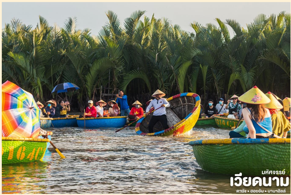
มหัศจรรย์ เวียดนาม ดานัง • ฮอยอัน • บานาฮิลล์