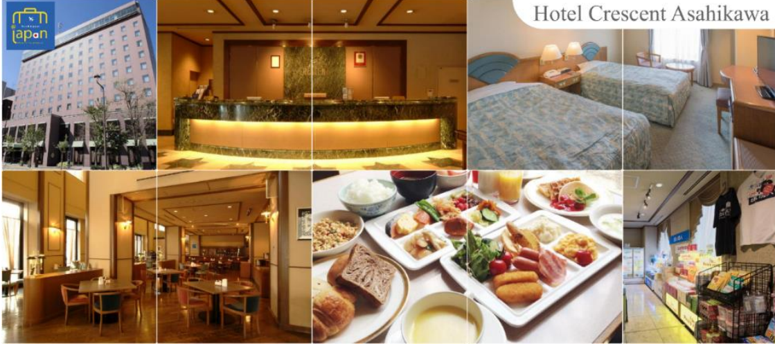
Hotel Crescent Asahikawa

HOTEL CRESCENT ASAHIKAWA หรือเทียบเท่าระดับเดียวกัน