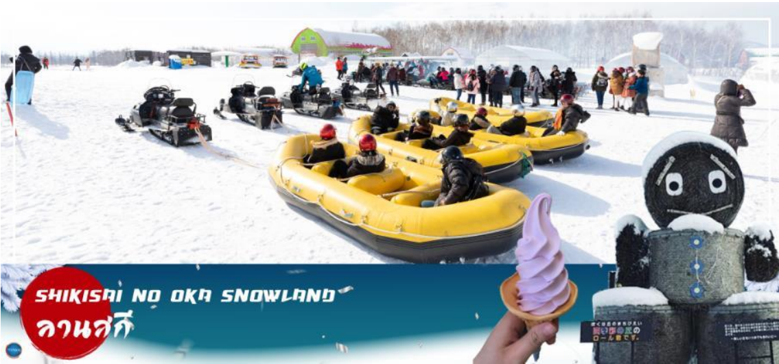
SHIKISAI NO OKA SNOWLAND ลานสกี

เมืองอาซาฮิคาว่า – เมืองฟูราโนะ – ลานสโนว์ เวิลด์ (กิจกรรมทางหิมะ) – หมู่บ้านเทพนิยาย นิงเกิ้ลเทอเรส – เมืองซัปโปโร – ถนนช้อปปิ้งทานุกิโคจิ