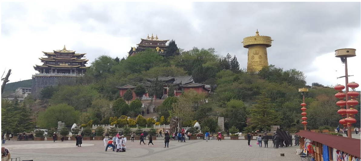
SHTGKM6 คุณหมิง ต้าหลี่ ลี่เจียง แซงกรील่า 6 วัน 5 คืน ธ.ค.67-เม.ย.67 TG (090724)

นำท่านเดินทางสู่ เมืองจางเจี้ยน “ แซงกรील่า ” (ใช้เวลาเดินทางประมาณ 2.30 ชั่วโมง) ซึ่งอยู่ทางทิศตะวันออกเฉียงเหนือของมณฑลยูนนานซึ่งมีพรมแดนติดกับอาณาเขตหน้าซี ของเมืองลี่เจียง และอาณาจักรหยาซีของเมืองหนิงหลง สถานที่แห่งนี้จึงได้ชื่อว่า “ ดินแดนแห่งความฝัน ” ระหว่างทางท่านจะได้ ผ่านชมโค้งแรกแม่น้ำแยงซี เกิดจากแม่น้ำแยงซีที่ไหลลงมาจากชิงไห่และทิเบต ซึ่งเป็นที่ราบสูงไหลลงมากกระทบกับเขาให้หลอ แล้วหักเส้นทางโค้งไปทางทิศตะวันออกเฉียงเหนือ จนเกิดเป็น “ โค้งแรกแม่น้ำแยงซี ” ขึ้น จากนั้นนำท่านเดินทางสู่ เมืองโบราณแซงกรील่า เป็นศูนย์รวมของวัฒนธรรมชาวทิเบตลักษณะคล้ายชุมชนเมืองโบราณทิเบตซึ่งเต็มไปด้วยร้านค้าของคนพื้นเมืองและร้านขายสินค้าที่ระลึกมากมาย