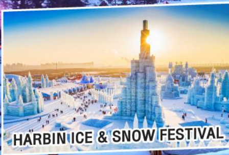
HARBIN ICE & SNOW FESTIVAL