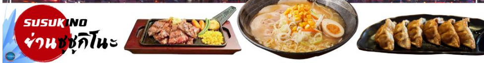
SUSUKINO ย่านซุซุกิโนะ