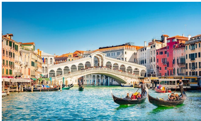
9 | รูปภาพประกอบใช้เพื่อการโฆษณาเท่านั้น

จากนั้น นำท่านชมเมืองอันแสนโรแมนติกซึ่งเป็นจุดหมายปลายทางของคู่รักจากทั่วโลก นำท่านเดินเยี่ยมชมจุดสำคัญต่างๆของเกาะเวนิส อาทิเช่น มหาวิหารเซนต์มาร์ค (ST.MARK'S BASIICA) มหาวิหารที่ตั้งอยู่บน จัตุรัสซานมาร์โค (PIAZZA SAN MARCO) กลางเมืองเวนิส เป็นมหาวิหารที่ได้รับสมญานามว่าโบสถ์ทองตั้งแต่ในศตวรรษที่ 11 ผ่านชม พระราชวังดอจส์ (DOGE'S PALACE) เป็นพระราชวังที่สร้างขึ้นในเวเนเซียนโกธิคสไตล์ พระราชวังเคยเป็นที่พำนักของดยุคแห่งเวนิสที่มีอำนาจสูงสุดของอดีตสาธารณรัฐสร้างขึ้นในปี 1340 และกลายเป็นพิพิธภัณฑ์ในปี 1923 ชม สะพานทอดถอนใจ หรือ สะพานคาสโนวา (BRIDGE OF SIGNS) เป็นสะพานที่เชื่อมต่อกับคุก นำ