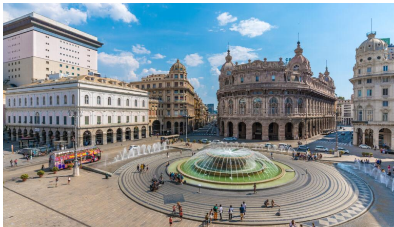
4 | รูปภาพประกอบใช้เพื่อการโฆษณาเท่านั้น

นำท่านเดินทางสู่เมืองเจนัว (GENOVA) (ระยะทาง 155 ก.ม. ใช้เวลาเดินทางประมาณ 2 ชั่วโมง) บ้านเกิดของคริสโตเฟอร์ โคลัมบัส นักเดินทางผู้ยิ่งใหญ่ค้นพบทวีปอเมริกา เป็นเมืองท่าพาณิชย์สำคัญของอิตาลี มีอายุเก่าแก่กว่าสองพันปี ปัจจุบันเป็นเมืองศูนย์กลางเทคโนโลยีและอุตสาหกรรมผลิตภัณฑ์ของอิตาลีได้แก่ เฟียต, อัลฟา โรมิโอ, แลนเซีย นำท่านชมจตุรัสมัตเตออดิ (Piazza San Matteo) ในย่านเมืองเก่าของเจนัว ซึ่งเป็นที่ตั้งของพระราชวังดยุก (Palazzo Ducale) หนึ่งในสัญลักษณ์ทางวัฒนธรรมที่สำคัญที่สุดของเมือง โดยอดีตเป็นที่พำนักของประมุขของเมือง นำท่านถ่ายรูปด้านหน้า มหาวิหารแซนลอว์เรนซ์ (Cathedral di San Lawrence) หรือ ดูโอโมที่สร้างขึ้นในแบบโรมันเนสส์และโกธิค ในสมัยศตวรรษที่ 12-14 ผ่านถนนจูเซปเป การ์ริบัลดี (Giuseppe Garibaldi) ถนนโบราณย่านเมืองเก่า เป็นที่ตั้งของจตุรัส เฟอร์ รารี (Piazza De Ferrari) ย่านช้อปปิ้งสายหลักของเมือง ตรงกลางจตุรัสมีน้ำพุขนาดใหญ่ตั้งอยู่อย่างเป็นเอกลักษณ์ และที่แห่งนี้ยังเป็นที่ตั้งของโรงโอเปร่า (Teatro Carlo Felice) ที่มีชื่อเสียงของเมือง