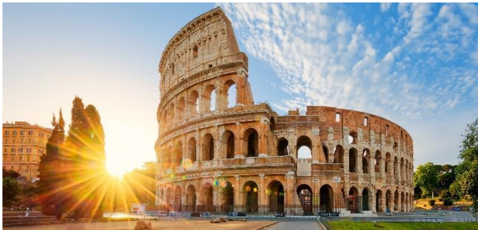
7 | รูปภาพประกอบใช้เพื่อการโฆษณาเท่านั้น

นำท่านเดินทางสู่ โรมันฟอรัม (ROMAN FORUM) อดีตศูนย์กลาง ทางด้านการเมือง ศาสนา และเศรษฐกิจของอาณาจักรโรมันที่สะท้อนเห็น ความเจริญรุ่งเรืองของอารยธรรมโรมันในช่วง 2,000 ปีที่ผ่านมา ชมความยิ่งใหญ่ในอดีตและเก็บภาพสวยงามบริเวณรอบนอกของ สนามกีฬาโคลอสเซียม (COLOSSEUM) 1 ใน 7 สิ่งมหัศจรรย์ของโลกยุคกลาง อดีตสนามการประลองการต่อสู้ที่ยิ่งใหญ่ของชาวโรมันที่สามารถจุผู้ชมได้ถึง 50,000 คน นำท่านถ่ายรูปเป็นที่ระลึก