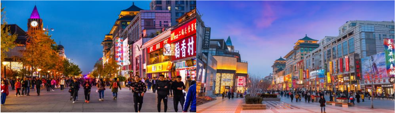
คำ รับประทานอาหาร ณ ร้านอาหาร เมนูพิเศษ!! สุกี่มองโกล นำทุกท่านเข้าสู่ที่พัก JINGLIN HOTEL , BEIJING ระดับ 4 ดาวท้องถิ่นหรือเทียบเท่า

นำท่านเดินทางสู่ ร้านยางพารา ให้ท่านได้เลือกชมสินค้าและผลิตภัณฑ์เพื่อสุขภาพชนิดต่างๆ นำท่านเดินทางต่อสู่ ถนนคนเดินหวังฝูจี้ (WANGFUJING SHOPPING STREET) เป็นหนึ่งในจุดท่องเที่ยวที่พลาดไม่ได้อย่างเด็ดขาด สำหรับนักท่องเที่ยวที่มาเยือนเมืองปักกิ่ง ประเทศจีน ได้ชื่อว่าเป็นแหล่งช้อปปิ้งที่นำตื่นตาตื่นใจคู่กับเมืองปักกิ่งมาช้านาน ซึ่งนอกจากจะเป็นถนนที่รวบรวมเอาสินค้าอันหลากหลาย ไม่ว่าจะเป็นเครื่องใช้ เสื้อผ้า ยังมีอาหารที่มีทั้งของขึ้นชื่อยอดนิยมของชาวจีน ไปจนอาหารแปลกตาที่หารับประทานไม่ได้ที่อื่น ถือได้ว่าเป็นหนึ่งในเอกลักษณ์และสีสันอันคึกคักของถนนหวังฝูจี้ ถนนแห่งนี้ยังมีขนมชื่อดังอย่าง ถังหูลู่ ให้ลองชิมอีกด้วย