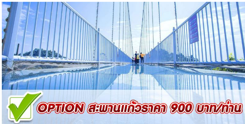
OPTION สะพานแก้วราคา 900 บาท/ท่าน

Option สะพานกระจกสามมิติเทียนเฉียนวิลล่า สะพานกระจก 3 มิติชื่อดัง ของ Dongguan Yinxian Villa สะพานกระจกยาว 286 เมตร กว้าง 3 เมตร สูง 92 เมตร เมื่อคุณก้าวขึ้นไปบนทะเลสาบ Yinxian จะมองเห็นภาพรวมของทิวทัศน์ที่สวยงามของเมือง พร้อมกับความตื่นเต้น