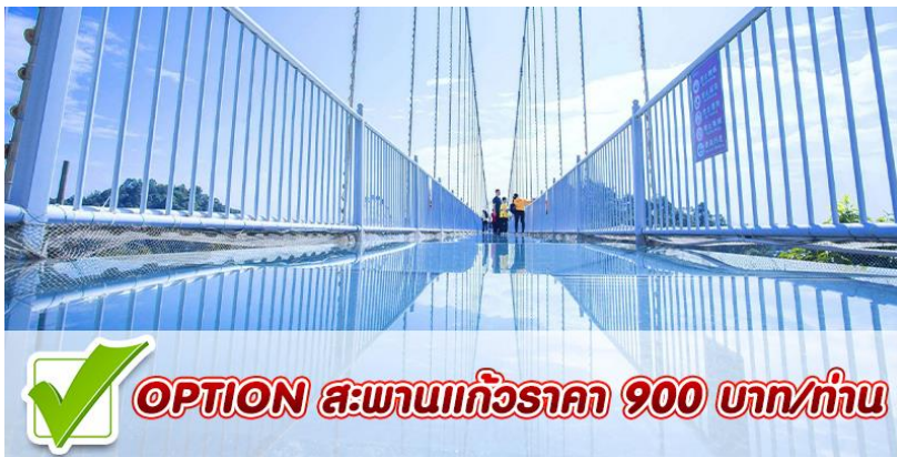
OPTION สะพานแก้วราคา 900 บาท/ท่าน

Option สะพานกระจกสามมิติเทียนเฉียนวิลล่า สะพานกระจก 3 มิติชื่อดัง ของ Dongguan Yinxian Villa สะพานกระจกยาว 286 เมตร กว้าง 3 เมตร สูง 92 เมตร เมื่อคุณก้าวขึ้นไปบนทะเลสาบ Yinxian จะมองเห็นภาพรวมของทิวทัศน์ที่สวยงามของเมือง พร้อมกับความตื่นเต้น