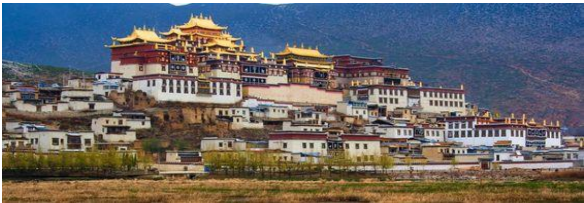
GO1CNXKMG-MU007 บินตรงเชียงใหม่ สัมผัส..เสน่ห์ คุนหมิง แชงกรีลา ย่ำดิง ปาลาเก๋อจง (นั่งรถไฟความเร็วสูง) ไม่ลงร้าน 6 วัน 5 คืน (MU)

จากนั้นนำท่านเที่ยวชม วัดลามะชงจ้านหลิน ตั้งอยู่บริเวณตีนเขาฝอปังห่างจากเมืองจางเตียนไปทางเหนือ 4 กิโลเมตรสร้างขึ้นในปีค.ศ. 1679 เป็นวัดลามะที่มีอายุเก่าแก่กว่า 300 ปีมีพระลามะจำพรรษาอยู่กว่า 700 รูปสร้างขึ้นในสมัยการปกครองของตะไลลามะองค์ที่ 5 ซึ่งใกล้เคียงกับสมัยอยุธยาตอนต้นในช่วงศตวรรษที่ 17 สมัยจักรพรรดิคังซีแห่งราชวงศ์ชิงได้มีการซ่อมแซมต่อเติมอีกหลายครั้งโครงสร้างของวัดแห่งนี้สร้างตามแบบพระราชวังโปตาลาในเมืองลาซา(ทิเบต) ที่มีหอประชุมหลัก 2 หอและโอบล้อมไปด้วยห้องพักสำหรับพระกว่า 100 ห้องนอกจากนี้ยังมีโบราณวัตถุอีกมากมายรวมทั้งรูปปั้นทองสัมฤทธิ์ที่มีชื่อเสียงมากที่สุดเดินทางต่อสู่เมืองลี่เจียงเป็นเมืองที่ตั้งอยู่ในหุบเขาที่มีทัศนียภาพงดงามเป็นถิ่นที่อยู่ของชนเผ่าลี่เจียงเป็นชนกลุ่มน้อยที่มีความน่าสนใจทั้งทางขนบธรรมเนียมและวัฒนธรรมเช่นการมีโครงสร้างทางสังคมแบบสตรีเป็นใหญ่ นอกจากนั้นยังมีภาษาภาพที่เป็นเอกลักษณ์อีกด้วย