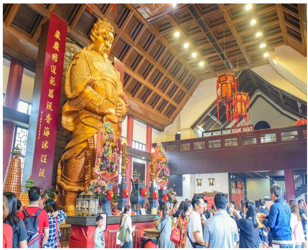
หน้าที่ 6 | ภาพประกอบใช้เพื่อการโฆษณาเท่านั้น

จากนั้นนำท่านเดินทางสู่ วัดแชกงหมิว หรือ วัดกัณฑ์ลม เป็นวัดที่ประชาชนชาวจีนเลื่อมใสศรัทธามาเนิ่นนาน สร้างขึ้นเพื่อระลึกถึงตำนานแห่งนักรบในสมัยราชวงศ์ซ่ง นักรบเอกนามว่า “แช กง” ยามท่านออกรบท่านจะใช้สัญลักษณ์รูปกัณฑ์ 4 ใบพัดติดไว้ด้านหลังหน้าขาขวากองทัพ จึงทำให้เหล่าทหารหาญมีความเชื่อว่าเมื่อพกพาสัญลักษณ์รูปกัณฑ์นี้ไปที่ใด ๆ กัณฑ์นี้จะช่วยเสริมสิริมงคล นำพาแต่ความโชคดี เสริมพลังอำนาจ ทำให้เกิดกำลังใจในการสู้รบ วัดแห่งนี้ยังเป็นหนึ่งในวัดยอดนิยมของนักท่องเที่ยวชาวไทย ซึ่งเป็นที่รำลึกถึงความศักดิ์สิทธิ์ในเรื่องของกัณฑ์ลมที่พัดพาสิ่งไม่ดีออกจากชีวิต ด้านในวัดทางด้านซ้ายมือของเราจะเป็นจุดจำหน่ายรูปและกระดาดทองซึ่งจัดไว้เป็นชุดๆ มีหลายราคาให้ท่านเลือก