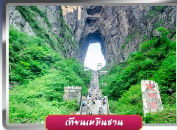
เทียนเหมินชาน