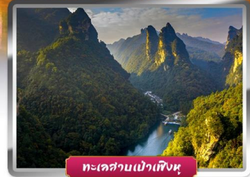
ทะเลสาบเป่าเฟิงหู