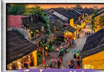
เมืองโบราณ Hoi an