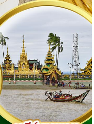
เจดีย์ยาเลพญา