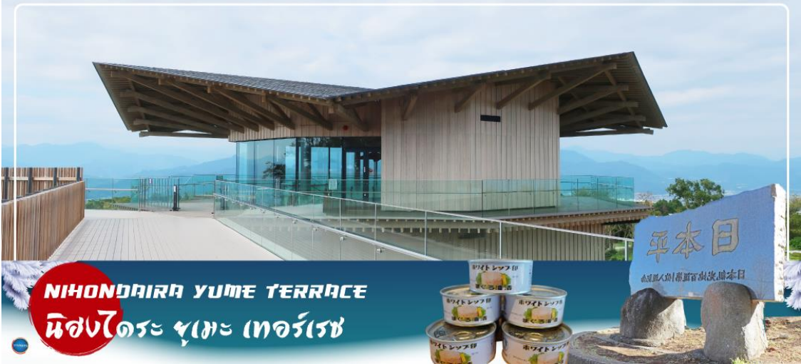
NIHONDAIRA YUME TERRACE นิสงไดระ ยูเมะ เทอร์เรซ

วันที่สี่ เมืองนาโกย่า – จังหวัดชิซุโอกะ – นิสงไดระ ยูเมะ เทอร์เรซ – น้ำตกชิราอิโตะ – เมืองยามานาชิ – หมู่บ้านโอชิโนะสึไก – ออนเซ็น + ขาปุยักษ์