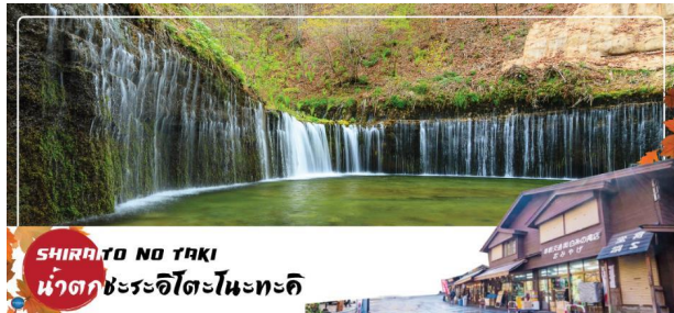
SHIRAITO NO TAKI น้ำตกชิระอิโตะโนะตะกิ

เที่ยง รับประทานอาหารกลางวัน ณ ภัตตาคาร (5) จากนั้นนำท่านสู่ น้ำตกชิราอิโตะ (Shiraito no taki) (ใช้เวลาเดินทางประมาณ 1.15 ชั่วโมง) เป็นน้ำตกตั้งอยู่ที่ เมืองฟูจิโนมียะ จังหวัดชิซุโอกะ เป็นส่วนหนึ่งของอุทยานแห่งชาติฟูจิซาคินเออิซุ ได้รับขึ้นทะเบียนเป็นมรดกโลกพร้อมกับภูเขาไฟฟูจิ อุทยานแห่งชาติฟูจิซาคินเออิซุ และทะเลสาบฟูจิทั้งห้าภายใต้ชื่อ "ฟูจิซัง สถานที่ศักดิ์สิทธิ์และแหล่งที่มาของความบันดาลใจทางศิลปะ" เมื่อวันที่ 22 มิถุนายน ค.ศ.2013 น้ำตกชิราอิโตะถือเป็นน้ำตกที่ศักดิ์สิทธิ์ มีศาลเจ้าอาซามะตั้งอยู่ด้วยการไหลของสายน้ำที่แยกสายออกเป็นหลากร้อยเส้น ทำให้มองดูแล้วเหมือนกับเส้นด้ายสีขาว จึงเป็นที่มาของชื่อเรียกที่ว่า ชิราอิโตะ ที่แปลตรงตัวว่า ด้ายสีขาวนั่นเอง อีกทั้งที่นี่ยังมีเรื่องราวของการปฏิบัติธรรมในถ้ำที่เคยเกิดภูเขาไฟปะทุขึ้นมาด้วย จึงทำให้ผู้คนให้ความศรัทธากันว่าเป็นที่ชำระล้างจิตใจ และเป็นพื้นที่ศักดิ์สิทธิ์สำคัญของผู้แสวงบุญ จึงถือเป็นพาเวอรส์สปอตอีกจุดหนึ่งในญี่ปุ่นที่ผู้สามารถชมฟูจิซังได้ในมุมที่ไม่เหมือนใคร เป็นน้ำตกและภูเขาไฟฟูจิตั้งอยู่ด้านหลัง และถือเป็นจุดชมใบไม้เปลี่ยนสีที่สวยงามมากอีกด้วย