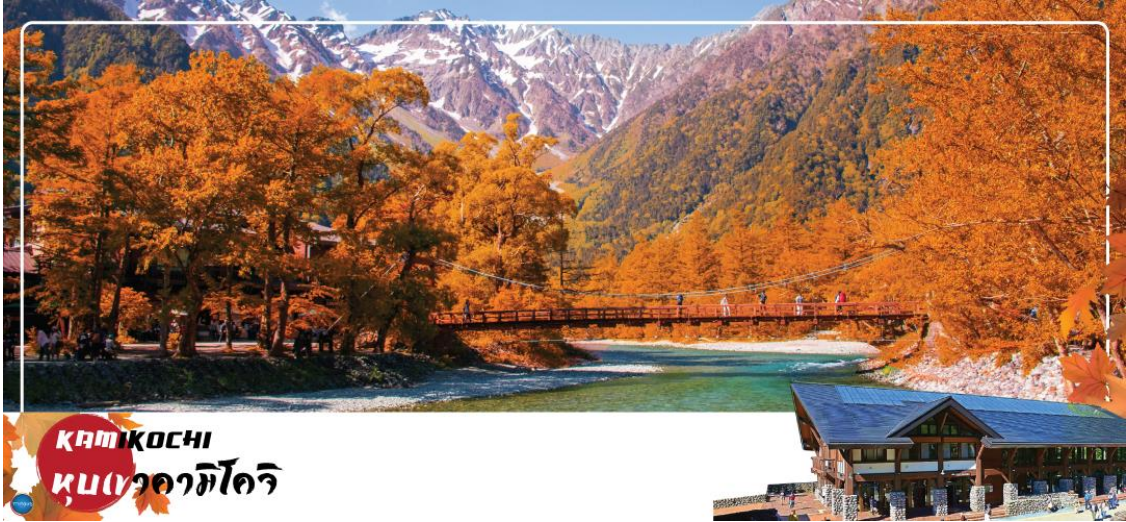
KAMIKOCHI หุบเขาคามิโคจิ

วันที่สี่ เมืองมัตสึโมโตะ – เมืองนากาโนะ – คามิโคจิ – สะพานคัปปะ – ย่านเมืองเก่านาราจิ จุก – เมืองนาโกยา – ย่านซากาเอะ