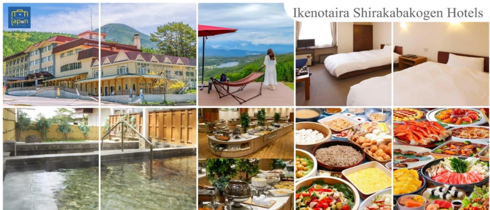
Ikenotaira Shirakabakogen Hotels

IKENOTAIRA SHIRAKABAKOGEN HOTELS, NAGANO หรือระดับเดียวกัน รับประทานอาหารค่ำ ณ ภัตตาคาร ของโรงแรม (5) --- บุฟเฟต์นานาชาติ หลังอาหารให้ท่านได้ผ่อนคลายกับการแช่น้ำแร่ธรรมชาติ เชื่อว่าถ้าได้แช่น้ำแร่แล้ว จะทำให้ผิวพรรณสวยงามและช่วยให้ระบบหมุนเวียนโลหิตดีขึ้น