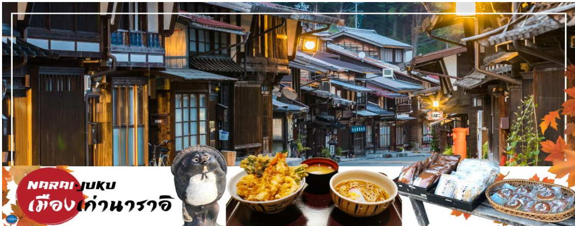
NARAI-JUKU เมืองเก่านาราจิ

เที่ยง อีสระรับประทานอาหารกลางวันตามอัธยาศัย