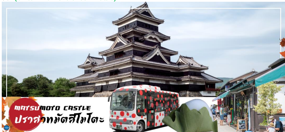
MATSUMOTO CASTLE ปราสาทมัตสึโมโตะ

นำท่านเดินทางสู่ เมืองมัตสึโมโตะ (Matsumoto) เป็นเมืองที่ใหญ่เป็นอันดับสองของจังหวัดนากา โนะ (ใช้เวลาเดินทางประมาณ 1 ชั่วโมง)