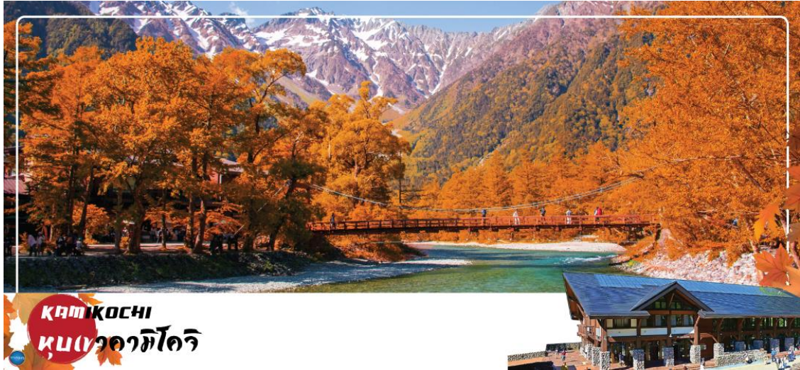
KAMIKOCHI หุบเขาคมิโคจิ

จากนั้นนำท่านเดินทางสู่ คามิโคจิ (Kamikochi) (ใช้เวลาเดินทางประมาณ 50 นาที) แหล่ง ท่องเที่ยวทางธรรมชาติที่มีทิวทัศน์เขาที่สวยงามที่สุดแห่งหนึ่งของประเทศญี่ปุ่น ดินแดนแห่ง ธรรมชาติท่ามกลางหุบเขาแสนสวยของเทือกเขา "เจแปน แอลป์" (Japan Alps) เป็นหุบเขาในฝันที่ อยู่สูงขึ้นไปทางเหนือของเทือกเขาแอลป์ญี่ปุ่น ภาพสายน้ำของแม่น้ำอะซุสะ ที่ใสสะอาดไหลผ่าน สะพานคัปปะ ล้อมรอบด้วยต้นป่าเขียวขจี และจากหลังของยอดเขาสูงตระหง่านระดับ 3,000 เมตร ให้ท่านได้เพลิดเพลินกับการเดินเล่นสบายๆ ไปกับธรรมชาติที่สวยงาม อิสระให้ท่านได้เก็บภาพความ ประทับใจตามอัธยาศัย สะพานคัปปะ-บะชิ เป็นจุดที่มีคนเยอะที่สุดในคมิโคจิ และในบางครั้งก็ให้ ความรู้สึกเหมือนทางแยกที่มีชื่อเสียงของชินจูะ มีผู้คนมากมายเดินข้ามไปข้ามมาอยู่ไม่หยุดหย่อน มา ถ่ายรูปใกล้กับสะพานหรือบนสะพาน