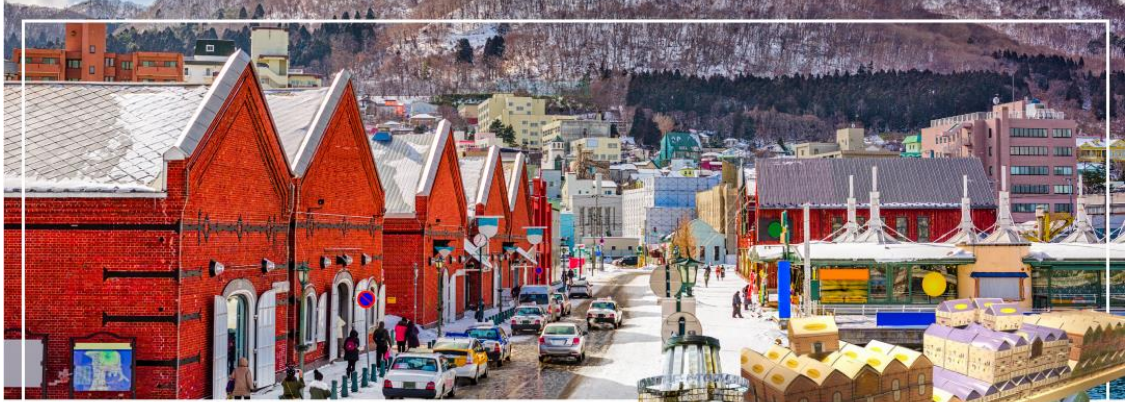
KANEMORI RED BRICK WAREHOUSE โกดังอิฐแดง

วันที่สาม เมืองฮาโกดาเตะ – โกดังอิฐแดง – ย่านเมืองเก่าโมโตมาชิ – ป้อมโกเรียวกาคู (เข้าชม) – อุทยานแห่งชาติทะเลสาบโทยะ – ทะเลสาบโทยะ – ออนเซน