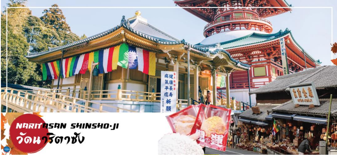
NARITASAN SHINSHO-JI วัดนาริตะชิน

วันที่ทก เมืองนาริตะ – วัดนาริตะชิน – ถนนโอโมเตะซังโดะ – อีออน มอลล์ – ท่าอากาศยานนานาชาตินาริตะ – ท่าอากาศยานสุวรรณภูมิ