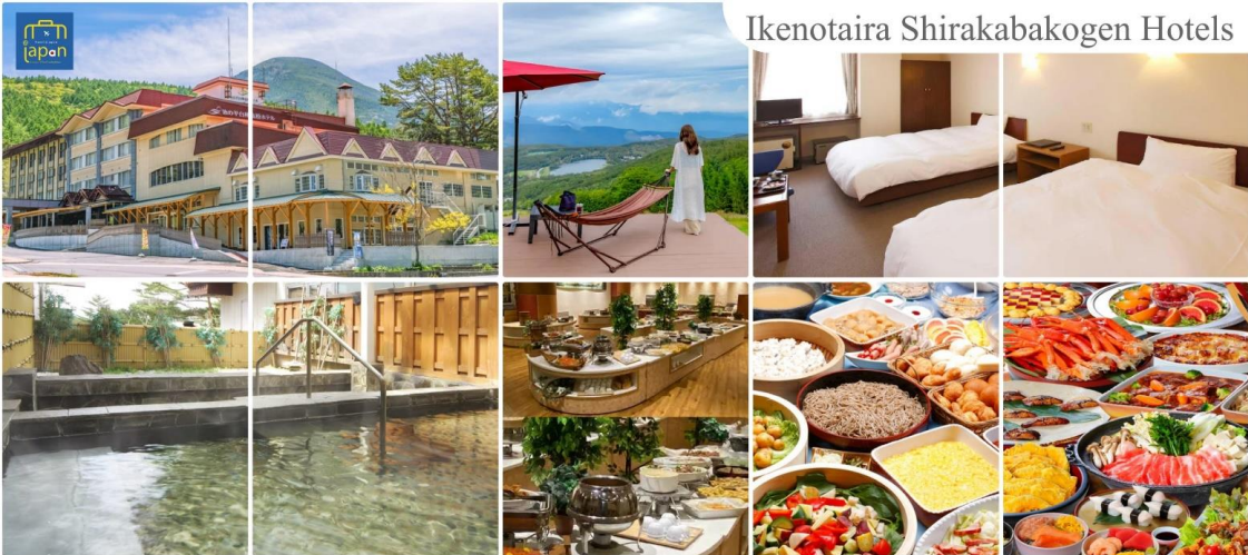
Ikenotaira Shirakabakogen Hotels

IKENOTAIRA SHIRAKABAKOGEN HOTELS, NAGANO หรือระดับเดียวกัน รับประทานอาหารค่ำ ณ ภัตตาคาร ของโรงแรม (4) หลังอาหารให้ท่านได้ผ่อนคลายกับการแช่น้ำแร่ธรรมชาติ เชื่อว่าถ้าได้แช่น้ำแร่แล้ว จะทำให้ ผิวพรรณสวยงามและช่วยให้ระบบหมุนเวียนโลหิตดีขึ้น