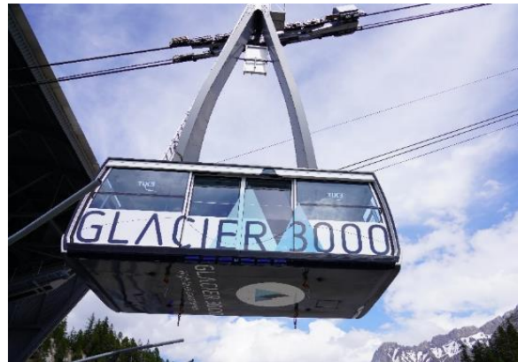
Highlight! กระเช้าไฟฟ้านาขนาดยักษ์ที่จุผู้โดยสารได้ถึง 125 คน

นำท่านเดินทางสู่ หมู่บ้านโกล เดอ ปียง (Col De Pillon) ประเทศสวิตเซอร์แลนด์ (ระยะทาง 292 กม. / 4.30 ชม.) เป็นที่ตั้งของสถานี จากนั้นนำท่านนั่งกระเช้าลอยฟ้า สู่ ยอดเขากลาเซียร์ 3000 (Glacier 3000) มีความสูงเกือบ 3,000 เมตรเหนือระดับน้ำทะเล ชมทิวทัศน์อันงดงามของท้องฟ้าและเทือกเขามากมายแบบพาโนรามา และให้ท่านทำกายความสูงเดินบนสะพาน "The Peak Walk by Tissot" สะพานแขวนที่มีความยาว 107 เมตร ข้ามหน้าผาที่ระดับความสูง 3,000 เมตร ทำให้เป็นสะพานแขวนที่สูงที่สุดในโลก อีสาระให้ท่านสนุกสนานกับกิจกรรมตามอัธยาศัย (ราคาทัวร์รวม Peak walk and View point / Glacier Walk / Ice Express (chairlift) / Fun Park กรุณาเช็คเครื่องเล่นต่างๆ กับหัวหน้าทัวร์อีกครั้ง)